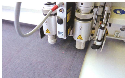
Von Handarbeit an der alten Fadenheftmaschine bis hin zum Digital Cutting mit modernster Technologie.