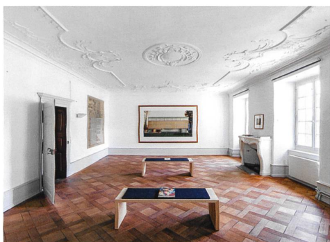
Grandgourt → 26