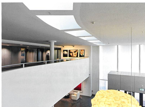
Zürich → 42