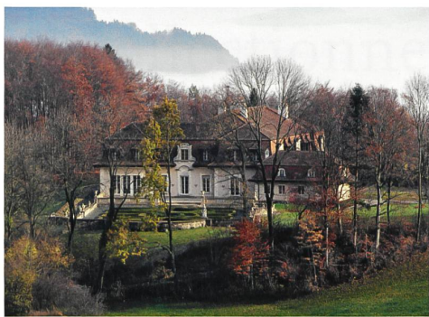
Riggisberg → 15