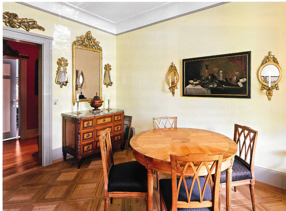
Ein kleines Gesamtkunstwerk aus bernischem Mobiliar und Grafik.