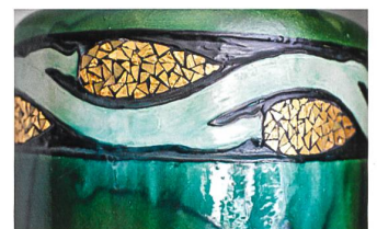
Als Gesamtes und in den Details bezaubernd: die Keramik von Max Laeuger.