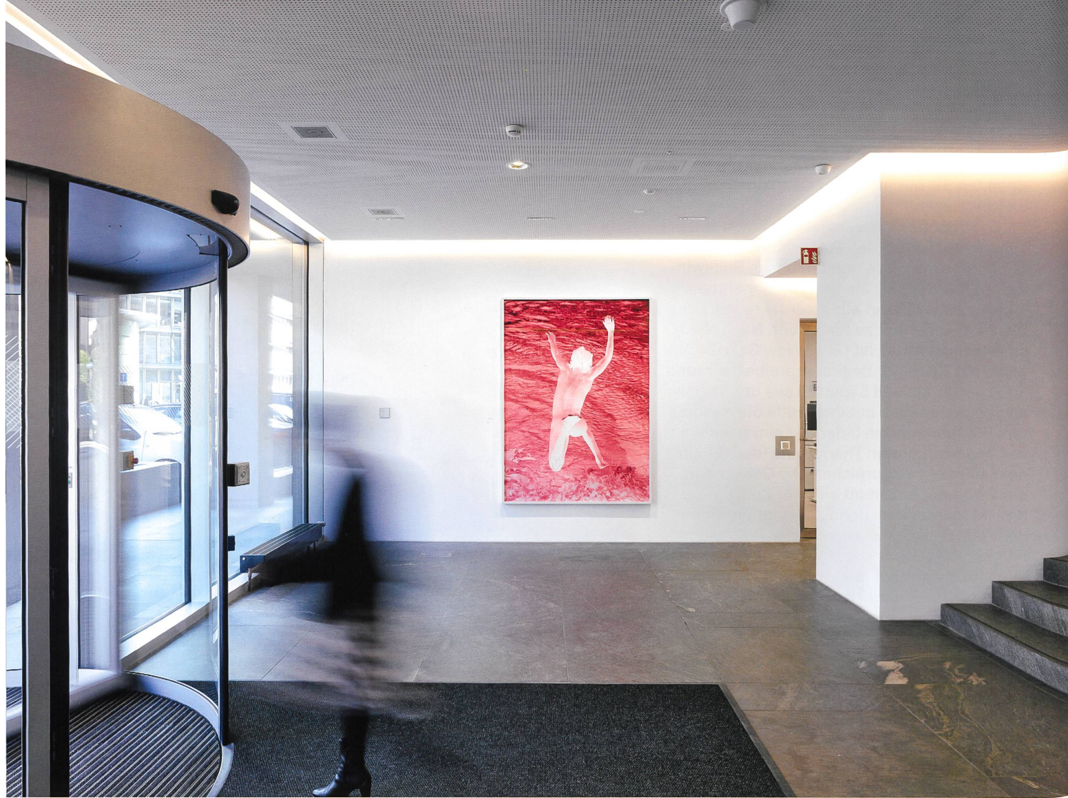
Lobby mit dem Werk X (2017) von Viviane Sassen. Foto Dirk Weiss, 2020