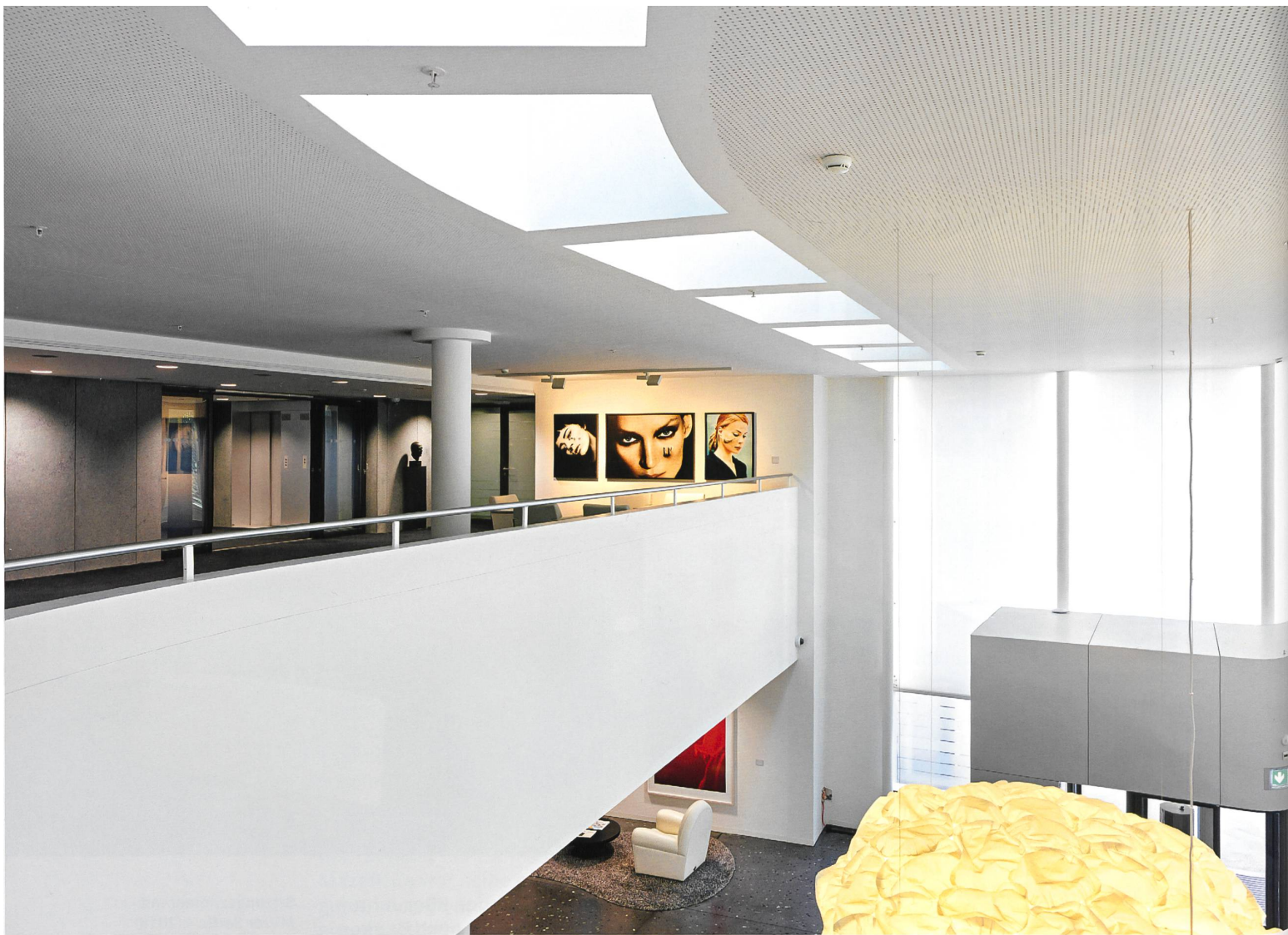
Foyer im Vontobel-Hauptsitz mit Werken aus der Serie Looking for Love (1996/2014) von Daniele Buetti.