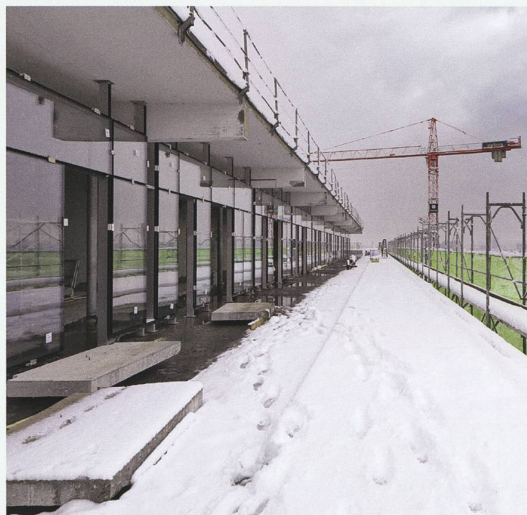
Die über 105 Meter langen Korridore des Spitals (links) werden zukünftig durch Bilder von M.C. Escher in eine Phantasiewelt verwandelt, jedes Geschoss wird eine eigene Identität erhalten. Im Dachgeschoss (rechts) finden sich nach dem Umbau Gemeinschaftsräume.

diesem Aspekt entstand auch die Treppenkaskade, die sich vom Erdgeschoss bis zum Dach hinzieht. Durch die Treppen, die in die bestehenden Gänge eingebaut werden, erhält man Räume, die in der Breite alternieren und sich in jedem Stockwerk unterscheiden. Damit erhält jedes Geschoss eine individuelle Ansicht und Identität. Diese Treppe ist das Kernstück des Miteinanderhauses in den oberen Stockwerken.