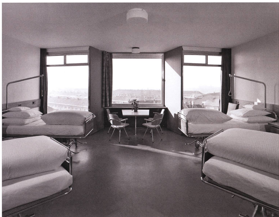
Weitsicht auf der Dachterrasse Richtung Elsass (oben), lichtetes Vierbettzimmer des ehemaligen Spitals (unten). Hier entsteht bis 2023 das generationenübergreifende «Miteinanderhaus» mit genossenschaftlichem Wohnraum.