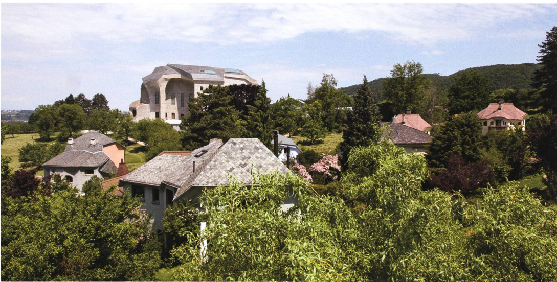
Oben: die kubische, strenge Ostseite des Goetheanums. Im Vordergrund der Gemüse- und Schnittblumengarten. Dahinter die Schreinerei. Rechts im Bild der Kamin des Heizhauses. Mitte: plastisch geformte Dächer der Kolonistenhäuser. Die Gebäude selbst verschwinden im dichten Grün der Parklandschaft. Unten: ökologische Bewirtschaftung der Wiesen rund um das Goetheanum. Fotos Michael Leuenberger

Bei der Gestaltung des Geländes wurden und werden heute noch zwei Grundprinzipien befolgt: Einerseits wird das Gelände als ganzheitlicher Organismus gesehen, in dem ein jeder Teil, vom Wegstein an der Westallee über die Parkbank des Rondells bis zum Hauptbau, in Beziehung zum andern und wiederum zum übergeordneten Ganzen steht, wobei sich die Teile je nach Lage und Funktion verwandeln (metamorphosieren). Andererseits wurden die Qualitäten des jeweiligen Ortes gesteigert zum Ausdruck gebracht, indem sie gezielt durch landschaftliche oder architektonische Eingriffe oder Elemente verstärkt wurden. 23 Der Idee der Ganzheit, der Biodiversität als Vielfalt von Lebensräumen, Arten und Genen ist auch die Bepflanzung des Geländes um das Goetheanum herum verpflichtet, die mit gelenkten Pflanzengesellschaften arbeitet und als Kreislaufwirtschaft angelegt ist. Gepflanzt werden Gemüse, Schnittblumen, Heil- und Färbepflanzen, Stauden