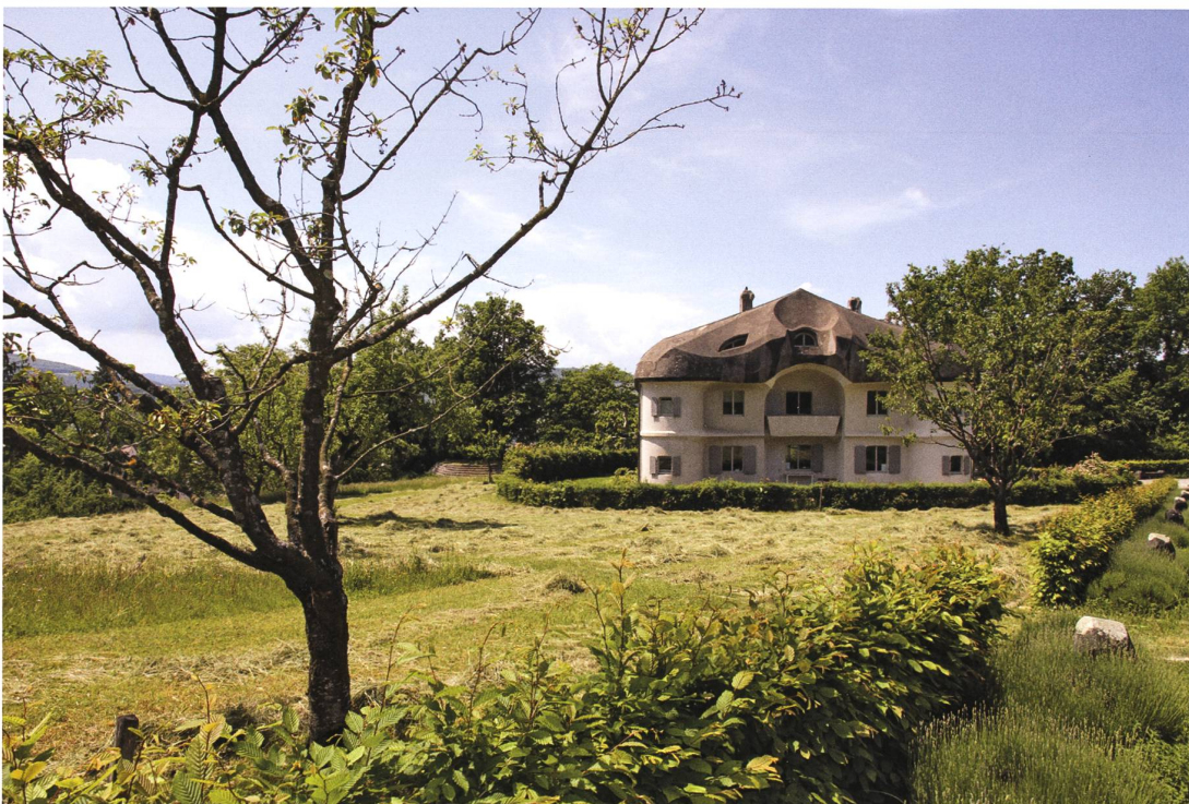
Oben: Eingebettet in die Landschaft: die Wohnhäuser für Eurythmisten (links, Rudolf Steiner und Edith Maryon, 1920). Ganz rechts das Haus De Jaager (Rudolf Steiner, 1921). Unten: Südwiese und Westallee. Im Hintergrund das Haus Duldeck (Rudolf Steiner, 1915). Das Wohnhaus ist heute Sitz des Rudolf Steiner Archivs.