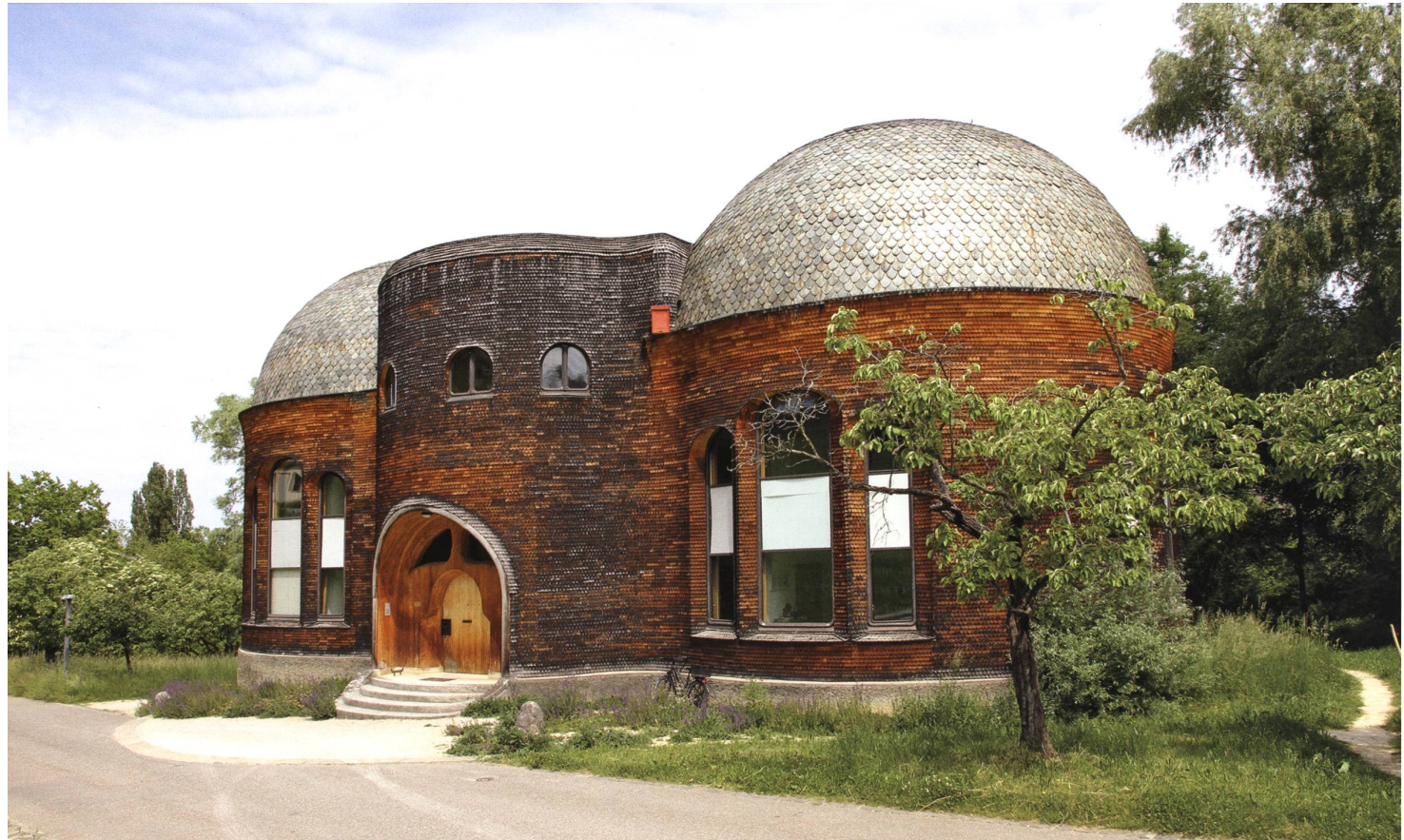
Glashaus (Rudolf Steiner, 1914). Der Holzbau mit seinen beiden schiefergedeckten Kuppeln erinnert in Formensprache und Materialität an das erste Goetheanum von 1913.

Anfang des 20. Jahrhunderts vor dem Hintergrund von Desintegration, Industrialisierung und Verstädterung mit der Idee einer ganzheitlichen und nachhaltigen Betrachtung der Welt mit all ihren Subsystemen ebenfalls eine kulturelle Revolution auslösen wollen. Auch wenn ihr das nur teilweise gelungen ist, so hat sie dennoch unser Denken in vielen Bereichen massgeblich geprägt. Die Rede ist hier von der anthroposophischen Bewegung und dem aus der Anthroposophie entwickelten organisch-dynamischen «Stil», wie ihn Rudolf Steiner (1861–1925), Begründer der Anthroposophie – ein philosophisch-wissenschaftlich fundierter, spiritueller Erkenntnisweg – und Vorreiter u.a. auf dem Gebiet der alternativen Wirtschaftsformen oder der biologisch-dynamischen Landwirtschaft, in über 60 Vorträgen beschrieben hat. 7 Seine Idee einer organisch-lebendigen oder «bewegten Architektur» im Gegensatz zur nichtorganischen, also einer statisch-abstrakten Betrachtungsweise von Architektur, hat mit dem Goetheanum nicht nur eines der bedeutendsten Gebäude des 20. Jahrhunderts hervorgebracht, sondern auch zum Bau einer Lebens- und Arbeitsgemeinschaft geführt. Diese Anthroposophen-Kolonie 8 auf dem Goetheanumhügel besteht, wenn auch in veränderter Form, noch heute, was sie einzigartig unter den Künstlerkolonien macht, die vom Ende des 19. Jahrhunderts bis zum Beginn des Ersten Weltkriegs Hochkonjunktur hatten.