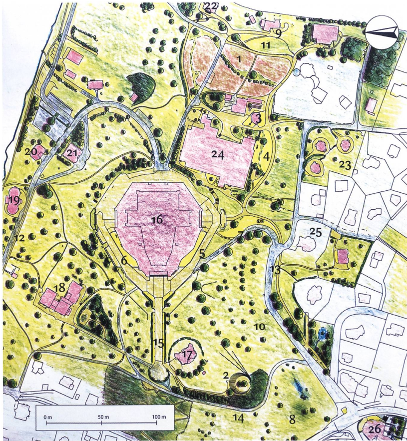
Plan des Gartenparks am Goetheanum. 1 Gemüse- und Schnittblumengarten, 2 Felsli, 4 Heilkräuter- und Färbepflanzengarten, 11 Duftkräutergarten, 14 Felsliweg, 15 Westallee, 17 Haus Duldeck. z.v.g.

und Obstbäume, wobei die Wahl der Pflanzen von den standortspezifischen Möglichkeiten bestimmt wird. Alle Garten- und Gemüseabfälle, Holz und Grasschnitt werden kompostiert und damit in einen Düngerkreislauf überführt.