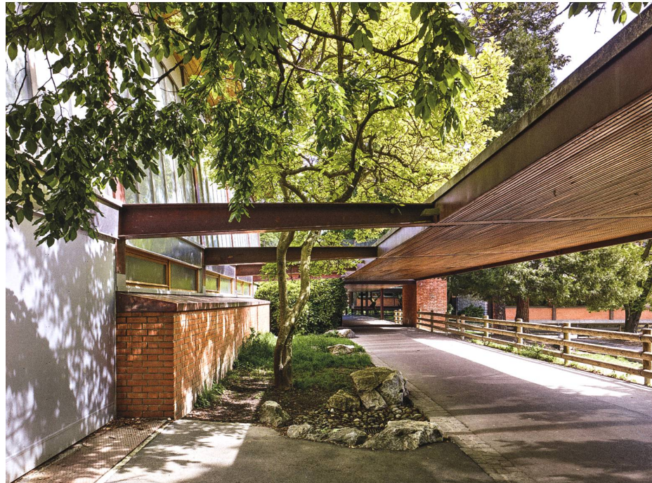
Chemin de liaison abrité entre les bâtiments C et D. Le plafond de cette structure extérieure est revêtu de lames de sapin, à l'instar des couloirs intérieurs qui semblent ainsi se prolonger dans la nature.

diffuse également dans le fond de la pièce. Dans l'école Geisendorf, le bâtiment C (1954-56) présente une solution double. D'une part, les grandes baies vitrées sont orientées vers le sud ou l'est; d'autre part, au dernier étage, l'apport de lumière naturelle directe est complété par une rangée de fenêtres au nord placées au sommet de la paroi de la salle de classe. De plus, dans chaque bâtiment et à chaque étage, l'éclairage indirect des couloirs participe à la luminosité des salles de classe par une baie vitrée intérieure.