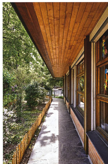
Bâtiment A (1952-53), école enfantine, façade sud (en haut), façade sud vue en direction de l'est (à gauche) et façade sud vue en direction de l'ouest (à droite). Les salles de classe sont éclairées naturellement grâce à de grandes baies vitrées qui laissent entrer la lumière du soleil. L'intensité de cette dernière est contrôlée par l'action commune de la végétation et des avant-toits qui empêchent les élèves d'être éblouis.

de bâtir des écoles plus petites, mais plus nombreuses. En effet, la planification de quartiers et d'écoles intègre l'idée de diminuer le temps et la dangerosité du trajet des enfants. La taille de l'école et la distance à parcourir pour l'atteindre doivent être relatives à l'âge de l'élève : plus l'enfant est petit, plus le chemin jusqu'à l'école doit être court. En revanche, les plus grands peuvent aisément changer de quartier ou de village pour atteindre leur école qui, pour le coup, regroupe plusieurs circonscriptions et est relativement plus volumineuse 4 .