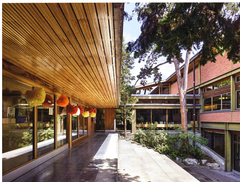
Photos 1 et 2 en haut : bâtiment A (1952-53), école enfantine, paroi nord d'une salle de classe. La lumière naturelle pénètre dans la pièce par la rangée de fenêtres au sommet de la paroi, ainsi que par l'espace vitré en dessous qui donne sur le couloir.