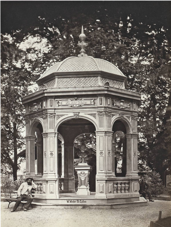
Abb. 7 Zürich, Landesausstellung 1883, Pavillon aus Zinkblech, gefertigt von Wilhelm Weder, Flaschner (Spengler), St. Gallen.