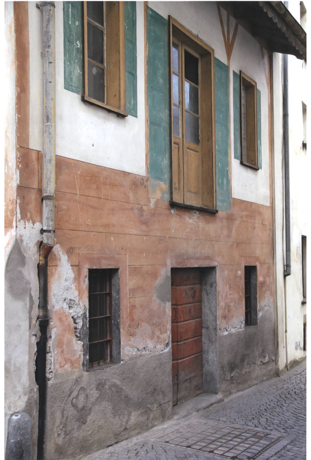
Abb. 8 Poschiavo GR, Nebengebäude (Via di Puntunai 157A) mit aufgemalten Holzbohlen, Fachwerk und Fensterläden, Bemalung wohl um 1900.

Kunstgeschichte, die Transformation des natürlichen Materials zu einem Kunstprodukt eine besondere Naturnähe zum Ausdruck bringen, weil sie mit der offensichtlichen Künstlichkeit nicht dem Verdacht des bloss Zufälligen ausgesetzt war.