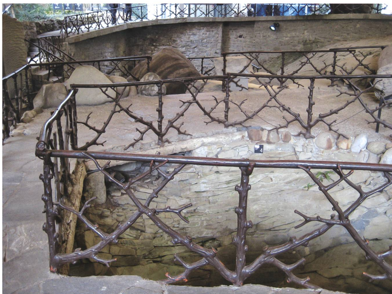
Abb. 3 Rüttenen bei Solothurn, Waldpark Wengistein, drahtarmiertes Betongeländer als Knüppelholzimitation, 1908.