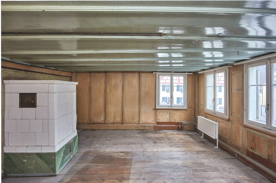
Abb.5 Bülach ZH, Altstadtthaus (Marktgassee 15), Kernbau 1600d: Stubentäfer 18./19.Jh. mit Maserierungsmalerei um 1900.