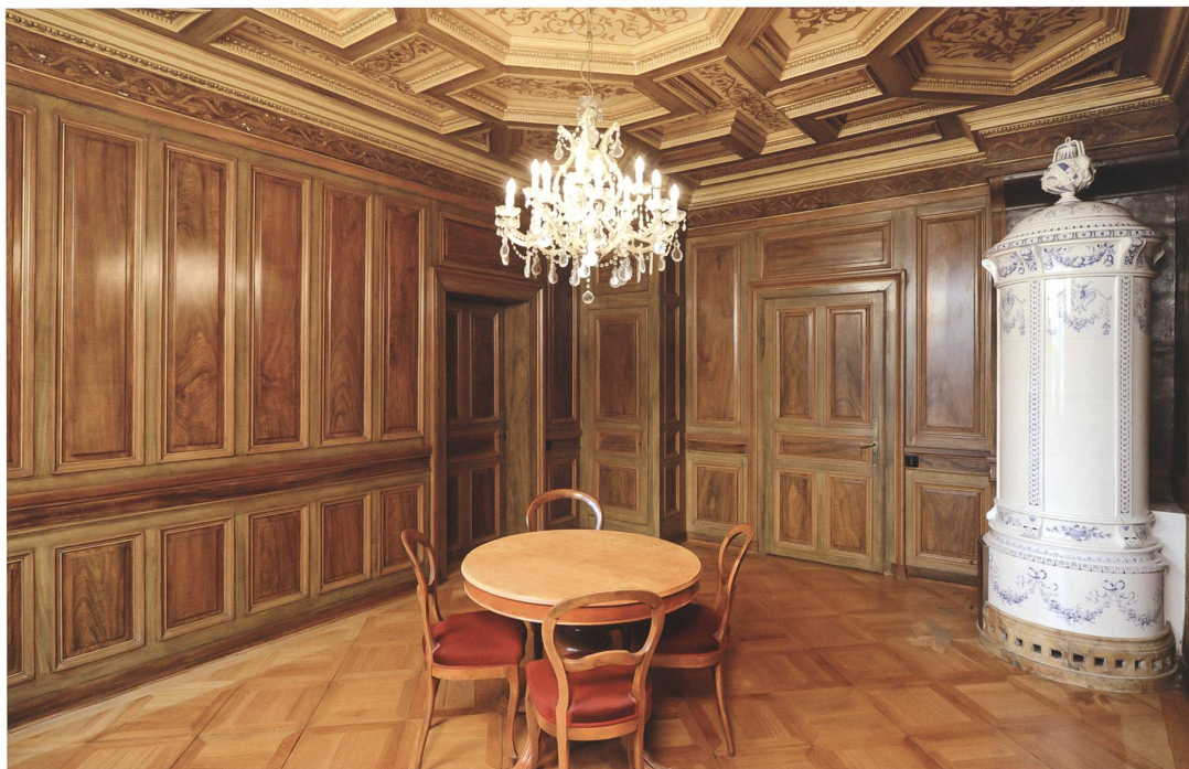
Abb.6 Thalwil ZH, Villa «Diana», 1873–1875 (rest. 1990–1992): aufwendige Maserierungsmalerei im Esszimmer. Kantonale Denkmalpflege Zürich, Fotoarchiv; Foto Francesco Hässig, 2016

«Gletschergarten», die sich gerade wegen ihrer Künstlichkeit in das visuelle Gedächtnis nicht weniger Besucher eingepägt haben dürften (Abb. 4). Bei der Eröffnung dieses berühmten Themenparks – einer «Bricolage aus Alpenmystik und Kurwalzer, aus naturkundlichem Kuriositätenkabinett und Landschaftsgärtnerei» – hatte man 1872 die