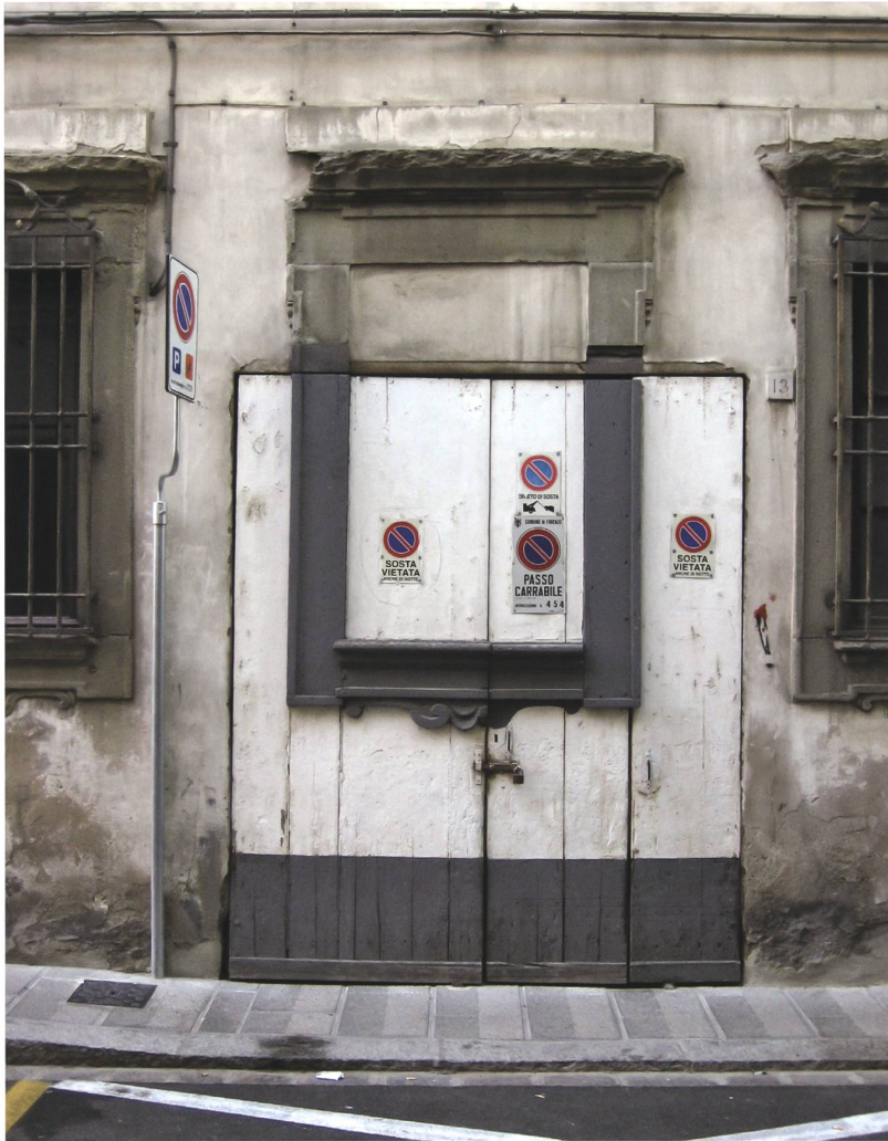
Abb. 10 Florenz, Garageneinfahrt am Borgo Pinti, wohl um 1900.

diese Absicht in einem Zinkblech-Pavillon zum Ausdruck, mit dem ein St. Galler Spengler 1883 auf der Landesausstellung in Zürich mitten auf dem Platzspitz die Möglichkeiten seines Metiers vorführte (Abb. 7): ein barockisierender, oktogonaler Kleinbau mit Korbbogenarkade, Balustergeländer und Dachhelm – eigentlich eine paradigmatische Steinarchitektur, die hier aber ganz aus dem gut formbaren und im 19. Jahrhundert für Zierformen und Baudetails entsprechend beliebten Material gefertigt war. 13 Als brauchte es noch einen Hinweis auf die Transformationsleistung der blossen Materie zu einem Kunstprodukt, funkelte auf einem Piedestal im Inneren eine glänzend polierte Athene als Göttin von Kunst und Handwerk.