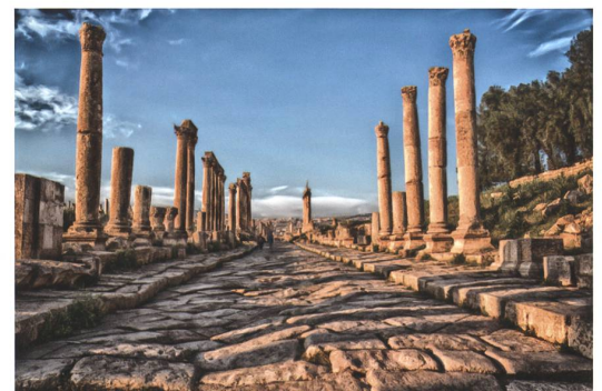
Kolonnadenstrasse in Gerasa.