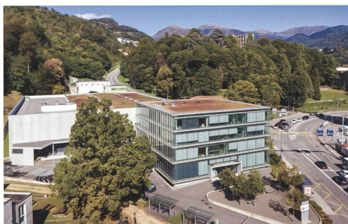
Lugano → 32