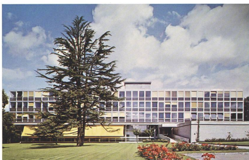
Genève → 22