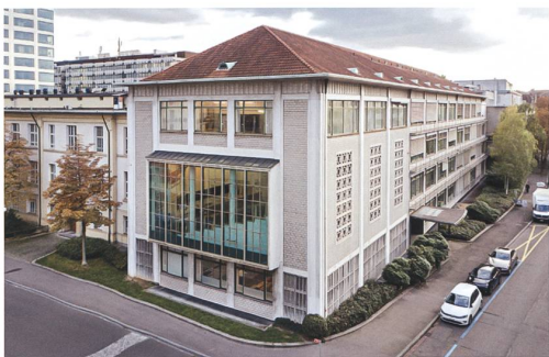
Basel → 5