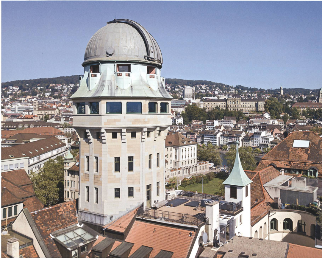
Die Sternwarte Urania in Zürich ist die älteste Volkssternwarte der Schweiz. Der markante Beobachtungsturm steht seit 1989 unter Denkmalschutz.

Präsent ist nach wie vor der ursprüngliche, nicht etwa symmetrische Grundriss, wie es damals für Observatorien üblich war. Das Grundmass seiner Gestaltung bildet der Beobachtungsturm, der als dezentrales Element die ganze Anlage mit Meridiansaal, Wirtschaftshof und Freiluftbeobachtungsterrasse «phrasiert». Die Fassaden zeigen, wie gekonnt die vier Elemente aufeinander bezogen sind. Sempers Sternwarte ist eine kubische Komposition, die beim Betrachten ein eindrückliches Gesamterlebnis hervorruft. Beim Umschreiten ergeben sich immer neue Silhouetten, definiert aus den verschiedenartigen Volumen von unterschiedlicher Höhe (flache und schräg gedeckte Kuben, Rundturm, Kuppel). Deren stark differenzierte horizontale Gliederung, die senkrechten Komponenten und die Farbigkeit der einzelnen Geschosse tragen zu diesem Erlebnis bei.