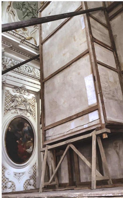
Il semplice sistema di allestimento dell'ancona visto dal coro della chiesa di San Giovanni.

Nel più noto ambito culturale degli apparati effimeri festivi si colloca invece l'altare posticcio chiamato "ancona" per la settecentesca chiesa di San Giovanni, realizzato nel 1794 da Giovanni Battista Bagutti e dal quadraturista Giovanni Battista Brenni (1730-1804) su commissione di Antonio Maria Baroffio. Solo quest'anno è stato riesposto, dopo decenni di attesa e studi per poterlo ripristinare e ricollocare entro la chiesa. L'altare è costituito da 25 pezzi in tela dipinta che raggiungono le dimensioni di 12 metri di altezza e 4 di larghezza; al centro una nicchia ospita la statua vestita dell' Addolorata , qui collocata una settimana prima delle Processioni, in occasione del Settenario di preghiere a lei dedicato. La visione frontale offre l'illusione quasi totale di una cappella voltata con due coppie di colonne su una sequenza di gradoni e zoccoli. Parte in basso dalla pedana dell'altare marmoreo originale e si eleva fino al cornicione che sorregge le volte, richiamato con esattezza nelle tele dipinte. L'altezza della cimasa semicircolare con gli angioletti su una nube potrebbe risultare ridotta rispetto allo spazio disponibile in quanto per certo era collocato qui sopra il "capocielo" o "baldacchino volante" (anch'esso eseguito dal Bagutti) visibile in alcune vecchie fotografie ma oggi smantellato e relegato nei depositi. Solo dal coro è possibile osservare la struttura posteriore di sostegno, molto semplice ma estremamente