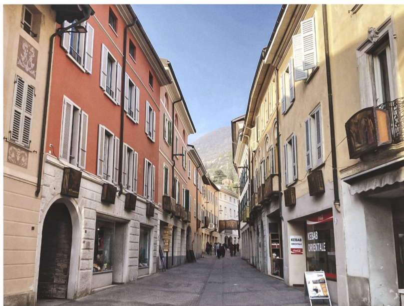
Corso Bello con "balconcini" ottocenteschi e una "porta" settecentesca.

I "trasparenti" illustrano prevalentemente episodi o figure di storia sacra in forme e stili diversificati a seconda dell'epoca di esecuzione, che inizia nel 1791 e prosegue tutt'oggi. Attestati come una novità mai vista in una lettera del 1791 confermata dalle firme e le date apposte su