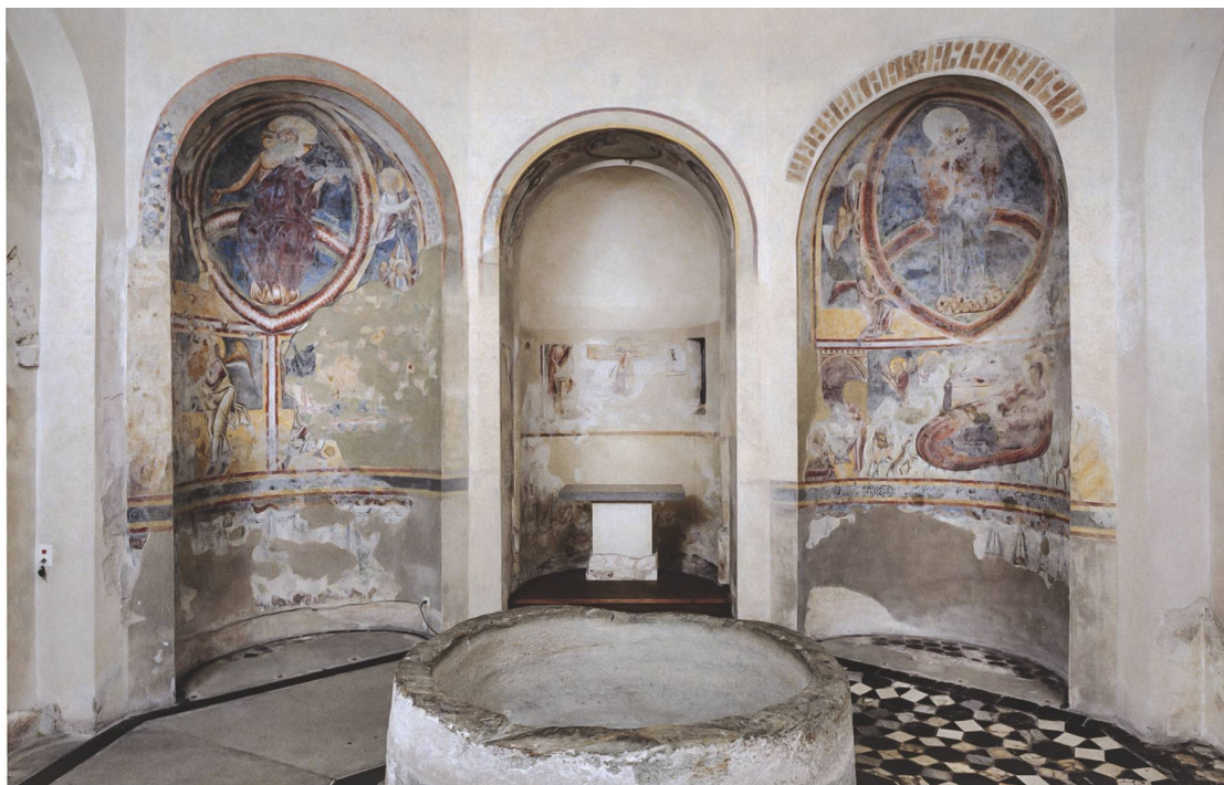
Fig. 3 Veduta dell'abside e dei nicchioni, prima dell'intervento di restauro del 2020.

un'importante campagna di restauro condotta dal Master in Conservazione e Restauro della SUPSI 1 . Le ricerche effettuate in questa occasione hanno permesso di indagare approfonditamente la tecnica di esecuzione delle diverse fasi pittoriche, confrontandone materiali e procedure, in modo da chiarire alcuni aspetti ancora aperti relativi alla loro cronologia.