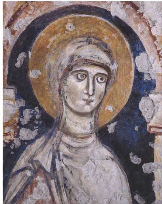
Fig. 10 Il santo diacono dipinto sul piedritto sinistro del sottarco absidale, dopo il restauro del 2020.

ato di calce, a conferma di un intervento guidato non tanto da un metodo omogeneo ma piuttosto dalla disponibilità dei materiali del momento.