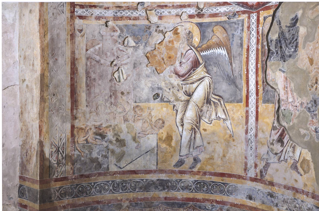
Fig.6 Nicchia nord-est, Resurrezione dei beati , in una foto precedente il restauro in corso, si distingue un intonaco sottostante riferibile a un ciclo pittorico più antico.

sul piedritto sinistro, una decorazione a racemi e motivi floreali è stata talvolta collegata al ciclo di impronta bizantina delle due nicchie, sebbene se ne distingue dal punto di vista tecnico per l'impiego di un diverso tipo di intonaco (fig. 7, a sinistra).