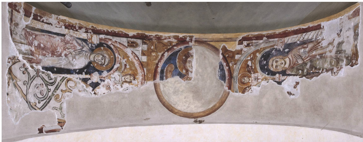
Fig. 7 Veduta del sottarco absidale, dopo il restauro del 2020.