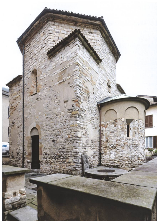
Fig.2 Veduta del Battistero dal lato sud.