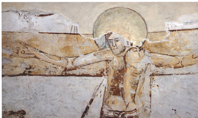
Fig. 5 Part. del Cristo crocifisso, dopo l'intervento di restauro del 2020.

Fino al 2020 i dipinti apparivano fortemente appesantiti dalle numerose stuccature, dai ritocchi alterati e dalle vaste integrazioni "a neutro", in alcune parti completate da velature a continuare l'antica decorazione (fig. 3): la varietà di colore e aspetto delle integrazioni e l'assenza di una chiara e unitaria impostazione metodologica ostacolavano fortemente la lettura dell'insieme dei frammenti pittorici.