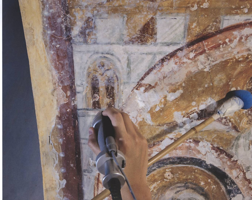
Fig.11 Part. del sottarco, durante la fase di pulitura con strumentazione laser per la rimozione dei residui di scialbo.

Dopo una prima rimozione delle polveri con pennellesse morbide, si è proceduto con la pulitura delle superfici, finalizzata alla rimozione dei depositi coerenti, dei residui di scialbo e dei ritocchi alterati. I sistemi adottati sono stati differenziati in funzione della natura dei materiali da rimuovere, della composizione e dello stato di