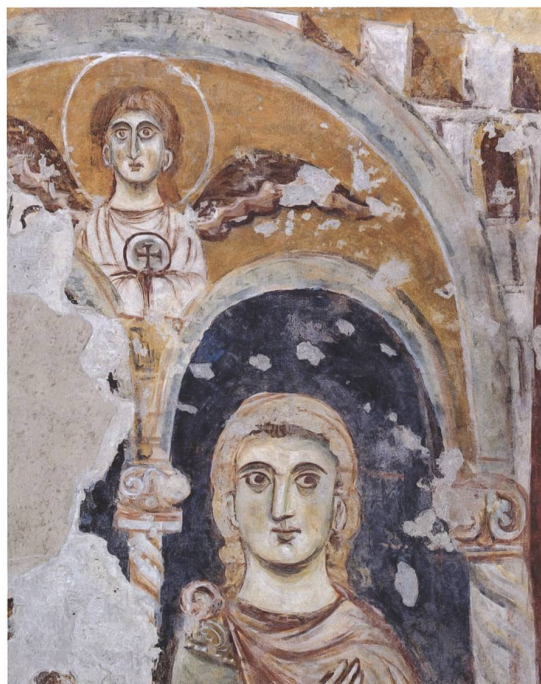
Fig. 9 Part. del volto della figura aureolata, dopo il restauro del 2020.