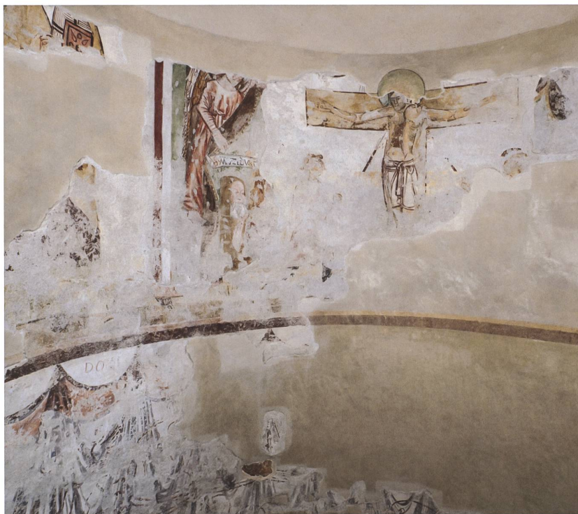
Fig. 4 Veduta del tamburo absidale.