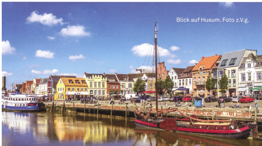
Blick auf Husum.