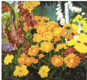
Emil Nolde: Blumengarten in Seebüll.

Als literarisch Interessierte wird uns am Morgen das Budenbrook-Haus beschäftigen. Das Museum dokumentiert die Familiengeschichte der Lübecker Kaufmanns- und Senatorenfamilie Mann, deren Söhne Thomas und Heinrich hier geboren wurden. Im St.-Annen-Museum lernen wir Spitzenwerke europäischen Kunstschaffens des Mittelalters kennen. Zu einem Nachtessen finden wir uns am Abend in der historischen Schiffergesellschaft ein.