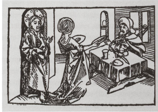
Die vier Holzschritte aus dem 15. Jahrhundert zeigen die Privilegien, die dem Pilger auf seiner Fahrt zustehen: (beide Bilder in der oberen Reihe) Dem Pilger soll Herberge sowie Gastrecht angeboten werden, und (beide Bilder in der unteren Reihe) der Pilger soll gepflegt werden. Der im Hintergrund erscheinende Christus macht deutlich, dass der im Sinne Christi handelnde Mensch zu seinem Nachfolger wird. Die vier Illustrationen stammen aus zwei verschiedenen Ausgaben eines um 1487 entstandenen Traktats, der ein Gespräch zwischen einem unbekannten Pilger und Bruder Klaus wiedergibt. Aus: Robert Durrer. Bruder Klaus . Reprint Sarnen 1981

Herausbildung einer europäischen Kultur immer noch frei assoziiert werden kann. 1993 hat die UNESCO vier spanische Routen des Jakobswegs zum Weltkulturerbe erklärt.