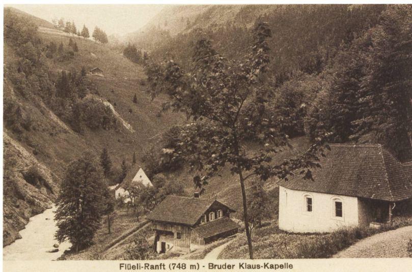
Flüeli-Ranft (748 m) - Bruder Klaus-Kapelle