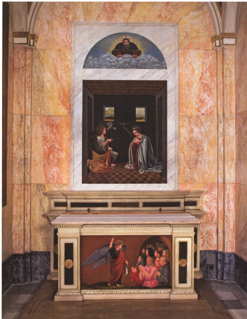
Bernardino De Conti, Ancona dell'Annunciazione , 1502 ca., tempera grassa su tavola.

superiori, ed era in origine dedicata all' Ascensione . Ospita un gruppo plastico raffigurante il tema della Resurrezione, uno dei dogmi fondamentali e caratteristici del Cristianesimo, con Gesù risorto, un angelo e tre soldati, opera di Alessandro Rossi (1886).