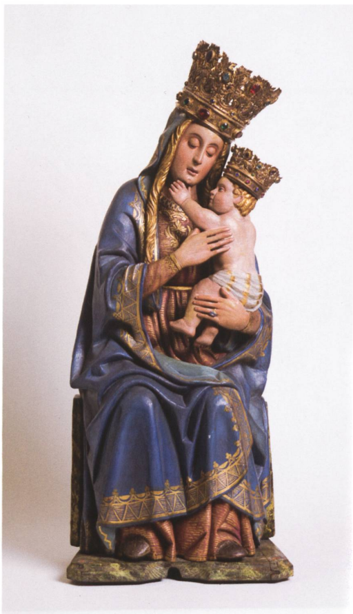
Maestro di Santa Maria Maggiore, Madonna in trono con il Bambino (Madonna del Sasso) , 1487 ca., legno policromo e dorato.