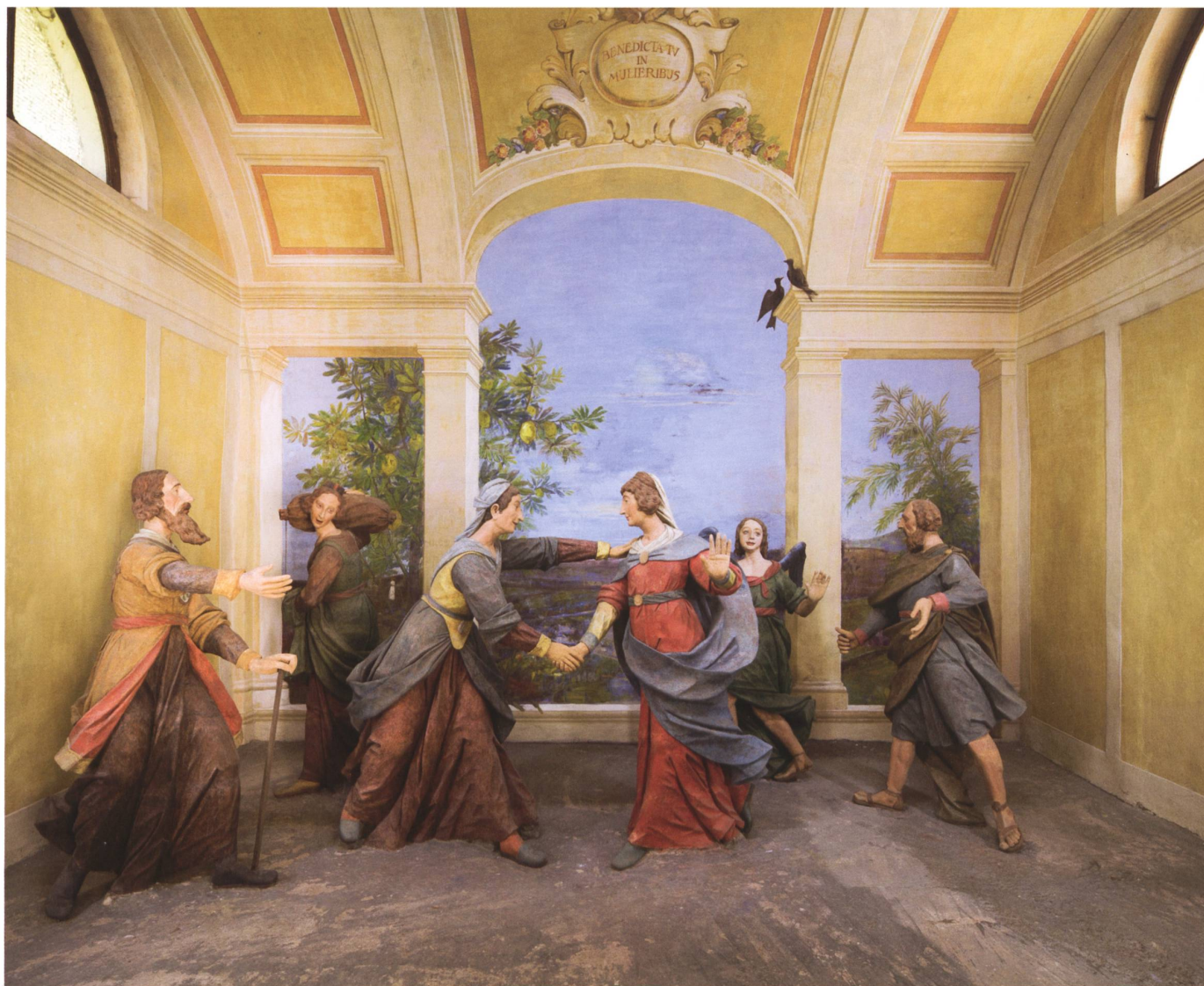
Cappella della Visitazione.