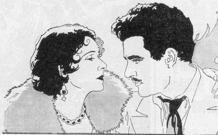
Norma Talmadge et Gilbert Roland dans „Nuits de New-York“.

Il semble qu'en Suisse, le parlant a amené au cinéma de nombreux nouveaux fidèles. Les recettes sont généralement en augmentation notable ; heureusement d'ailleurs, car les prix de location eux aussi sont en grande hausse.