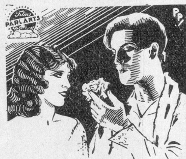
Dennis King & Jeanette MacDonald in einer Szene der ersten Sprechfilm-Oper der Paramount Der König der Vagabunden.

Signalons d'autre part que, poursuivant son programme d'extension, le Service de Distribution Haik va organiser très prochainement son agence Suisse.