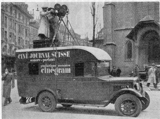
On filme à Lausanne...

Dès que nous avons eu connaissance de cette nouvelle, nous avons été trouver le sympathique et entreprenant « produc-