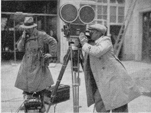
En plein travail...

Système d'enregistrement à densité fixe, d'une qualité irréprochable, aussi bien pour le studio qu'en plein air, pour les paroles que pour la musique.