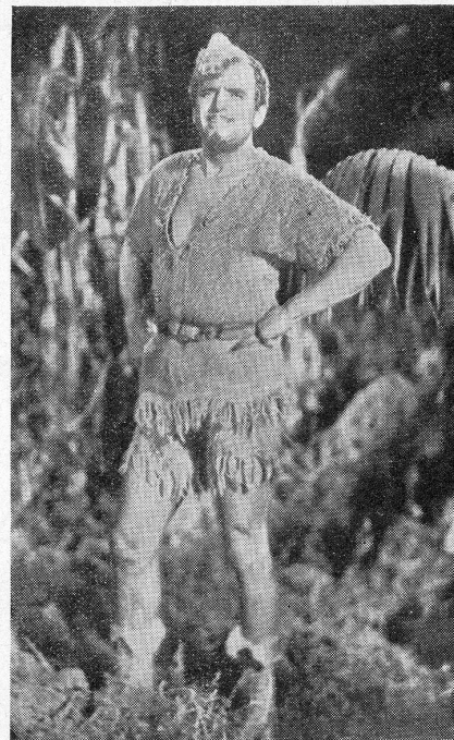
Douglas Fairbanks dans Robinson Moderne

— 26. Januar. Laut Statuten vom 25. Januar 1933 ist, mit Sitz in Glarus, unter der Firma Dux Film A. G. (Dux Film Ltd.) (Dux Film S. A.) eine Aktiengesellschaft von unbestimmter Dauer gegründet worden. Zweck der Gesellschaft ist die Beteiligung an Unternehmen aller Art, die Verwaltung von Beteiligungen, Erwerb, Verwaltung und Verwertung von Vermögenswerten aller Art, insbesondere Filmrechten, Liegenschaften usw., die Herstellung von Filmen, deren Verwertung und die Durchführung aller damit zusammenhängenden Geschäfte jeder Art, sei es im eigenen Namen und auf eigene Rechnung, oder für fremden Namen und Rechnung oder als Treuhänder. Die Gesellschaft ist berechtigt, Zweigniederlassungen im