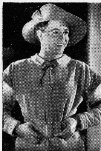
Willy Fritsch im Ufa-Grossfilm «Turandot».

Die Ufa dreht «Johanna von Orleans»-Film. Die Ufa wird im Rahmen ihres diesjährigen Produktions-Programms einen grossen Tonfilm vom Leben und Sterben der Jeanne d'Arc drehen. Das Manuskript zu dem neuen grossen Film