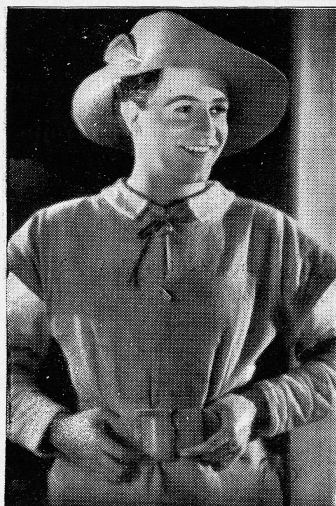
Willy Fritsch im Ufa-Grossfilm «Turandot».

Die Ufa dreht «Johanna von Orleans»-Film. Die Ufa wird im Rahmen ihres diesjährigen Produktions-Programms einen grossen Tonfilm vom Leben und Sterben der Jeanne d'Arc drehen. Das Manuskript zu dem neuen grossen Film