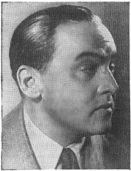
Le producteur Erich Pommer.

Le nom de Erich Pommer est attaché à tant de productions de grande classe, qu'il n'est pas nécessaire de dire autre chose de lui pour vanter ses qualités inégalables de producteur. Citons simplement quelques titres :