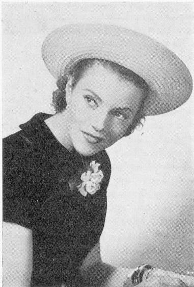
Annabella, die reizende Darstellerin in «Das Schloss im Mond», (Wings of the Morning). Film Technicolor New World Pictures 20th Century Fox.

Auch mit der schönen Norma Shearer muss nur über die Schwierigkeiten gesprochen werden, die sie am Beginn ihrer Laufbahn zu überwinden hatte, um sie sofort in Tränen ausbrechen zu lassen.