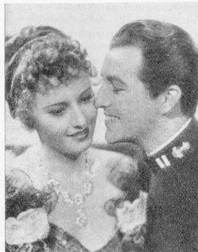
Robert Taylor und Barbara Stanwyck bilden ein ideales Paar im neuen Spitzenfilm der 20th Century Fox: «Unter vier Augen.»