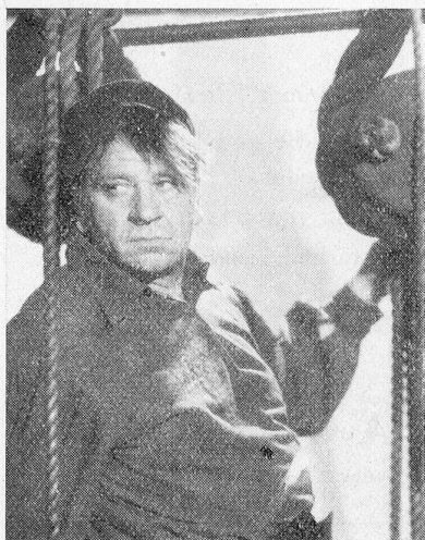
Wallace Beery, welcher in «Das letzte Sklavenschiff» wiederum eine grossartige Rolle besetzt.

Duviviers neuer Film «Aus der Vergangenheit einer Frau» («Un carnet de Bal»), der auf der Biennale als bester ausländischer Film den Preis Mussolinis erhielt, ist über den Dialog hinaus international verständlich, weil es sich innerhalb einer Rahmenerzählung um einzelne grosse Szenen handelt, die in sich abgeschlossen wirken. Eine Frau in mittleren Jahren, verwitwet und vereinsamt, erinnert sich nach Jahren ihres ersten Balles. Sie reist ihren Erinnerungen nach, sucht die Männer auf, die damals ihren Namen auf ihre Tanzkarte geschrieben haben und erlebt teils tragische teils komische Enttäuschungen. Denn die Tänzer von damals sind «verdorben, gestorben» oder zu braven, behäbigen, ehrgeizlosen Spiessern geworden. Es bleibt nur der