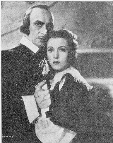
Annabella und Conrad Veidt im Film der 20th Century Fox: «Die rote Robe.»

rades sind ausserdem aus konstruktiven Gründen enge Grenzen gezogen (da sonst der Anbau des Tonkopfes zu schwierig würde). Man ist daher vielfach verleitet worden, die Schwungradwirkung zu knapp zu berechnen. Wie die Erfahrung zeigt, können die Tonköpfe mit ungenügender Schwungradwirkung Anlass zu einem Schwanken in der Tonhöhe geben. Dieser Fehler kann sehr gut bei langanhaltenden Tönen bemerkt werden.