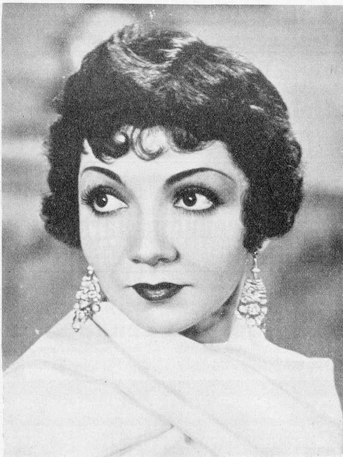
Claudette Colbert hat Hauptrollen in den Paramount-Filmen «Im Kreuzverhör», «Pariser Bekanntschaft», «Blaubarts achte Frau» und «Frauenlaunen», inne. (Im Verleih der EOS-Film-Aktiengesellschaft, Basel.)

In Paris wurde die «Cinématographique Française» gegründet, ein Unternehmen, das sich zum Ziel setzt, erfolgreiche Filme vor dem völligen Verderb zu retten und aufzubewahren. Sehr wertvolle und für die Entwicklung der Filmkunst wichtige Filme gingen im Laufe der Jahre zugrunde, weil sie nicht systematisch gesammelt und gepflegt wurden. Dem will das Pariser Filmarchiv abhelfen. Es wird auch ein Verzeichnis über die in Privatsammlungen aufbewahrten alten Filme führen. Das Unternehmen ist ganz privat; es lebt von Mitgliederbeiträgen, Schenkungen und den Einkünften aus geschlossenen Vorführungen für Mitglieder, Universitäten, Künstlerkreisen. Das Archiv besitzt nicht nur französische, sondern u. a. auch deutsche Filme der Vor- und Nachkriegszeit.