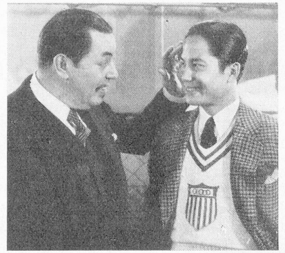
Warner Oland und Keye Luke in: «Charly Chan an der Olympiade.» 20th Century Fox.

N. V. Filmex, die holländische Produktionsfirma, will in der kommenden Spielzeit zwei oder drei Filme herstellen und auf diese Weise den Beginn einer holländischen Eigenproduktion fortsetzen. (LBB.)