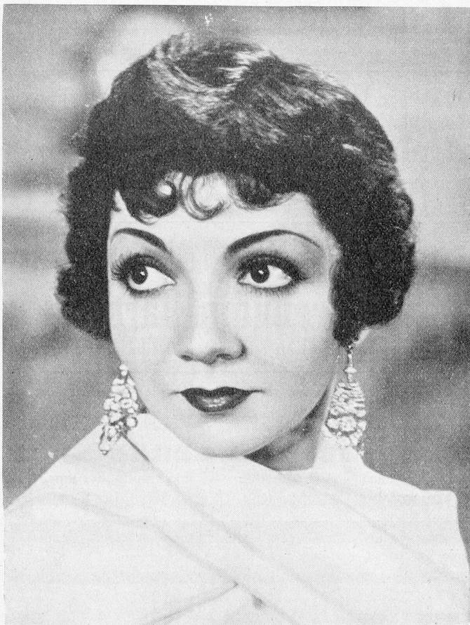
Claudette Colbert hat Hauptrollen in den Paramount-Filmen «Im Kreuzverhör», «Pariser Bekanntschaft», «Blaubarts achte Frau» und «Frauenlaunen», inne. (Im Verleih der EOS-Film-Aktiengesellschaft, Basel.)

In Paris wurde die «Cinématographique Française» gegründet, ein Unternehmen, das sich zum Ziel setzt, erfolgreiche Filme vor dem völligen Verderb zu retten und aufzubewahren. Sehr wertvolle und für die Entwicklung der Filmkunst wichtige Filme gingen im Laufe der Jahre zugrunde, weil sie nicht systematisch gesammelt und gepflegt wurden. Dem will das Pariser Filmarchiv abhelfen. Es wird auch ein Verzeichnis über die in Privatsammlungen aufbewahrten alten Filme führen. Das Unternehmen ist ganz privat; es lebt von Mitgliederbeiträgen, Schenkungen und den Einkünften aus geschlossenen Vorführungen für Mitglieder, Universitäten, Künstlerkreisen. Das Archiv besitzt nicht nur französische, sondern u. a. auch deutsche Filme der Vor- und Nachkriegszeit.