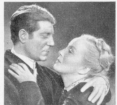
Jean Gabin und Dita Parlo in einer Szene des Jean Renoir-Films «La Grande Illusion». (Im Verleih der EOS-Film-Aktiengesellschaft, Basel.)

Die amerikanischen Autoren, Komponisten und Musikverleger sind in der «American Society of Composers, Authors and Publishers» zusammengeschlossen. Diese Standes-Organisation entspricht unserer schweizerischen «Sacem». Die Einnahmen