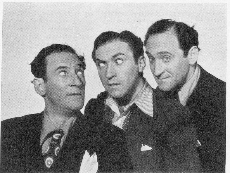
«Gehn wir bummeln» — die drei aussergewöhnlichen Komiker Ritz Brothers.