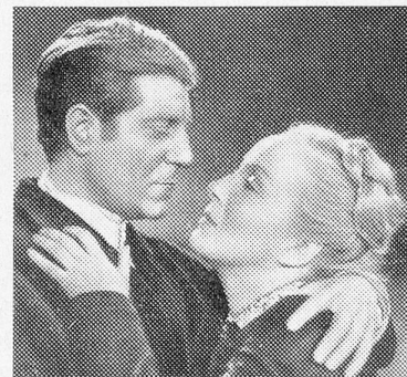
Jean Gabin und Dita Parlo in einer Szene des Jean Renoir-Films «La Grande Illusion». (Im Verleih der EOS-Film-Aktiengesellschaft, Basel.)

Die amerikanischen Autoren, Komponisten und Musikverleger sind in der «American Society of Composers, Authors and Publishers» zusammengeschlossen. Diese Standes-Organisation entspricht unserer schweizerischen «Sacem». Die Einnahmen