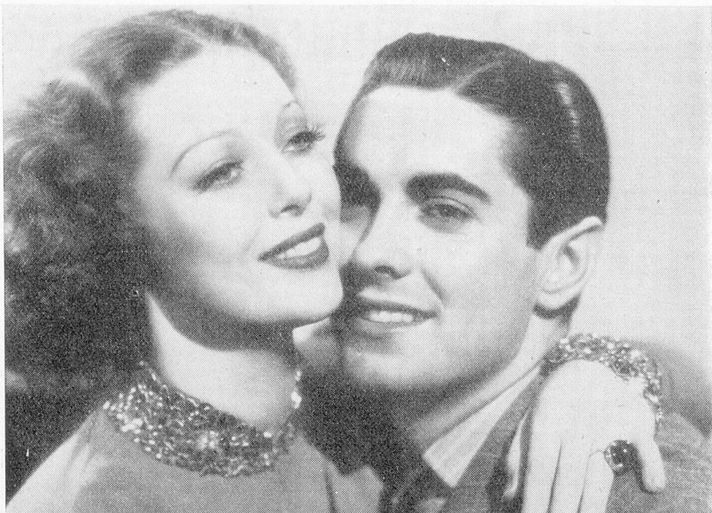
«Café Metropole» mit Loretta Young und Tyrone Power. 20th Century-Fox.

schluss gekommen. Es handelt sich dabei um die Erwerbung der im Besitz von Mary Pickford, Chaplin und Fairbanks sen. befindlichen Aktien der United Artists. Englische Filmzeitungen glauben zu wissen, dass das Geld für die Finanzierung in England aufgebracht worden sei. Korda hofft, durch diese Uebernahme seinem Film auf dem amerikanischen Markt eher Eingang zu verschaffen.