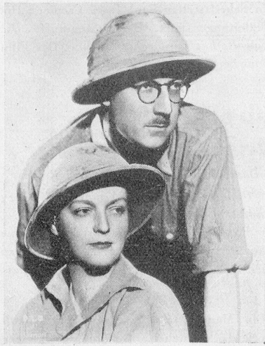
Armand Denis et Leila Roosevelt qui tournèrent le film magnifique «Magie africaine» (Dark Rapture) au Congo Belge.

Szenen der Eingeborenen in der Kamera festgehalten, die von sehr großer Bedeutung sind. Die Expedition stand unter dem Schutz S. H. Leopold III, König von Belgien. Eine offene Türe des unbekanntes Afrikas!