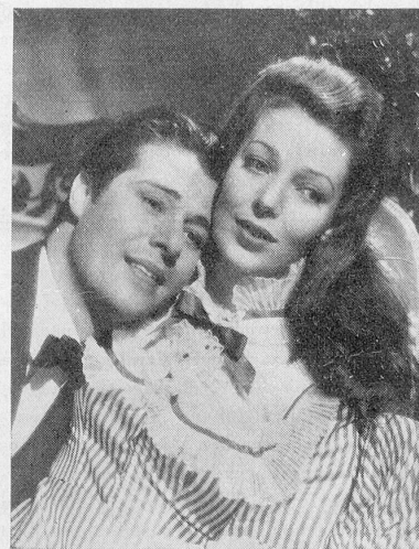
Loretta Young et Don Ameche dans «Et la parole fut ...» (The Story of Alexander Graham Bell). 20th Century-Fox.

«Charlie Chan in Reno» mit Sydney Toler und «Polizei-Inspektor Hurnleich» mit Gordon Harker; etc.