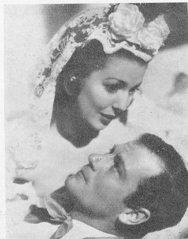
Loretta Young et Joel Mc.Crea, les deux principaux interprètes du film «Les trois souris aveugles».

Der bekannte schwedische Filmpionier Victor Sjöström wurde am 20. September 60 Jahre alt. Ihm ist es zu verdanken, daß der schwedische Film seinerzeit neue Wege einschlug und durch seine Qualität die Welt eroberte. Sjöström hat bewiesen, daß das Wesentlichste im Filme dessen Inhalt ist.