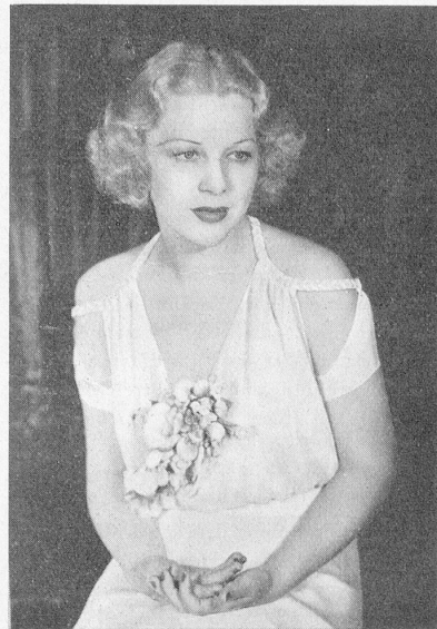
Hollywoods neue Bürgermeisterin Glenda Farrell betreut das Stadtsäckel.

Es dürfte aus der letzten Zeit kein bezeichnenderes Beispiel für die geschäftliche Ausdauer der Engländer geben als der Aufschwung, den die britische Filmindustrie im letzten Produktionshalbjahr genommen hat. Der englische Film war Ende 1938 finanziell vollkommen zusammengebrochen, selbst die optimistischsten Beurteiler der Sachlage konnten keinen Hoffnungsstrahl mehr entdecken. In dieser Situation berief die englische Regierung den sogenannten «Film Council», eine Körperschaft von fünfzehn unvoreingenommenen Sachverständigen, die in Gemeinschaft mit einer Gruppe junger Produzenten an den völligen Neuaufbau der heruntergewirtschafteten Industrie gingen. Es ist ihnen in wenigen Monaten gelungen, den englischen Film mit finanzieller Unterstützung der Regierung zu neuem ungeahntem Leben zu erwecken, allerdings auf völlig neuer Basis. Zunächst wurde das verderbliche Prinzip