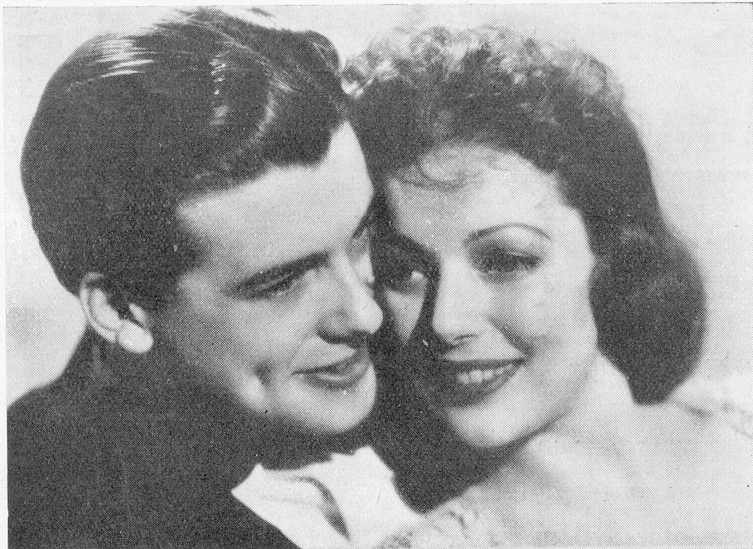
Un nouveau couple sympathique à l'écran Loretta Young et Richard Greene dans le beau film de la 20th Century-Fox «Quatre hommes et une prière».