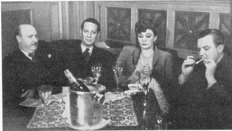
Zarah Leander in Zürich.