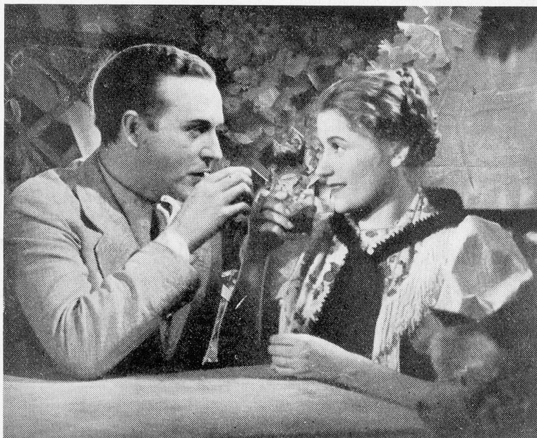
Willy Fritsch und Gisela Uhlen in dem dramatischen Ufa-Film «Die unvollkommene Liebe». In weiteren Hauptrollen spielen Ida Wüst und nach längerer Pause auch wieder Liane Haid. Eine Inszenierung von Erich Waschneck. Ein Film von Format.

In den letzten 40 Jahren hat die Technik der drahtlosen Bildübertragung Macht ergriffen über Raum und Zeit. Wir sind heute 128-mal schneller im Besitz von