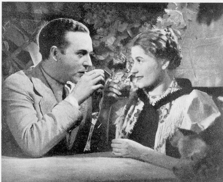
Willy Fritsch und Gisela Uhlen in dem dramatischen Ufa-Film «Die unvollkommene Liebe». In weiteren Hauptrollen spielen Ida Wüst und nach längerer Pause auch wieder Liane Haid. Eine Inszenierung von Erich Waschneck. Ein Film von Format.

In den letzten 40 Jahren hat die Technik der drahtlosen Bildübertragung Macht ergriffen über Raum und Zeit. Wir sind heute 128-mal schneller im Besitz von