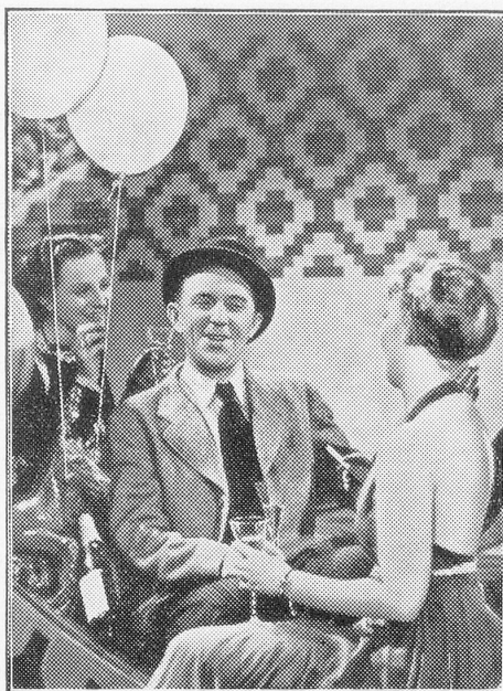
Theo Lingen in einer lustigen Szene des neuen Lustspiels «Drunter und drüber».

Nous reproduisons ces «conseils» car ils nous paraissent empreints d'une psychologie bien féminine, mais Myrna Loy ne manque pas d'ajouter malicieusement qu'il ne faut pas les suivre à la lettre, parce qu'alors la femme qui le ferait deviendrait une épouse parfaite et que la perfection ennuie toujours les hommes.