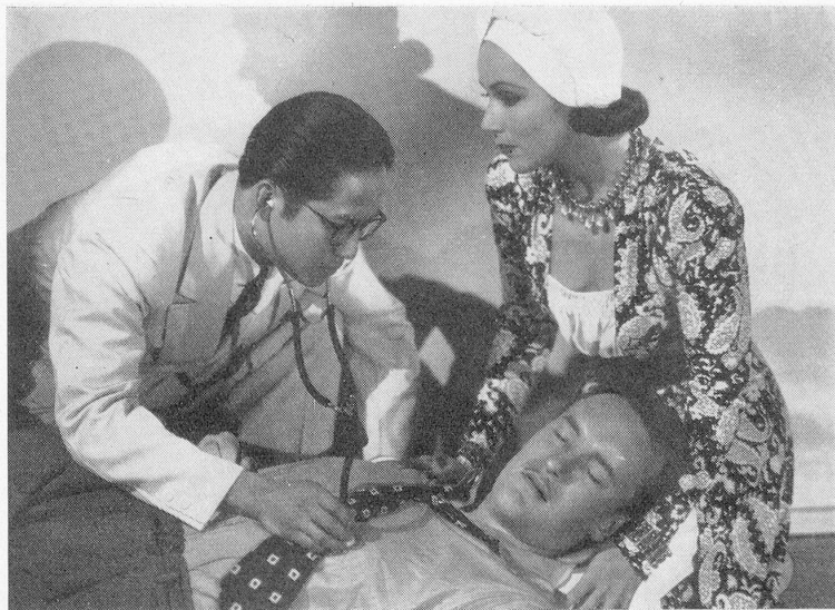
Shanghai, internationale Niederlassung.

Annie Ducaux, la belle actrice française, interprète de Prison sans Barreaux et de