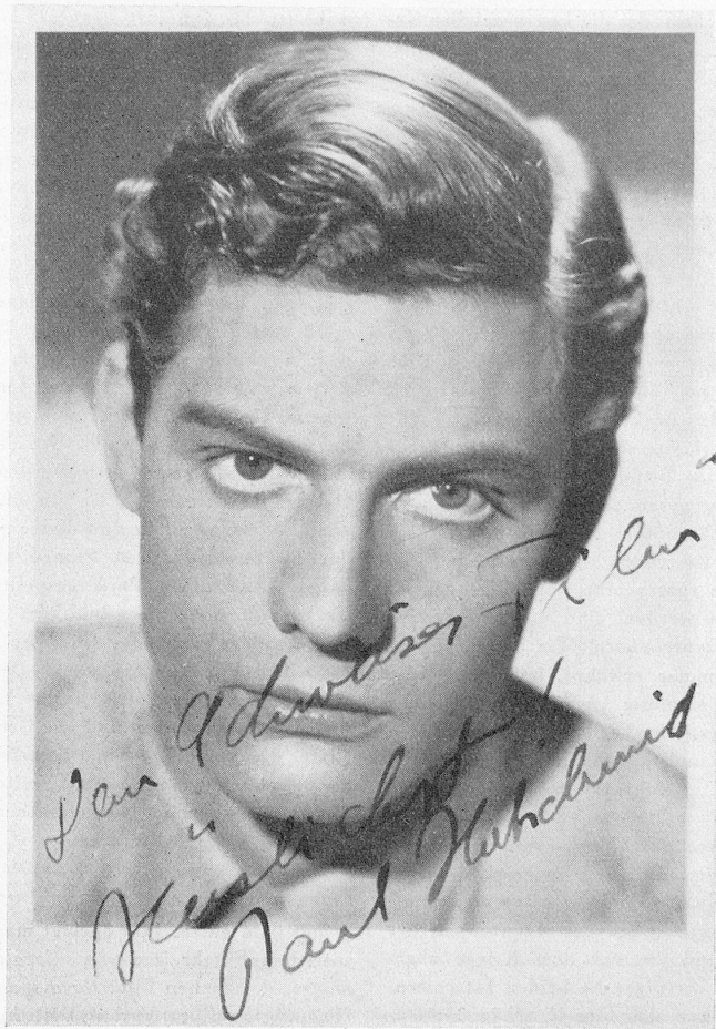
Paul Hubschmid, der aus dem «Füsilier Wipf» bestens bekannte Schweizer Filmschauspieler, der auch in dem Film «Maria Ilona» neben Paula Wessely und Willy Birgel eine wichtige Rolle inne hat, hatte die Liebenswürdigkeit, anlässlich seiner persönlichen Anwesenheit im Cinema Urban Zürich an die Besucher einige freundliche Worte zu richten, wobei er erwähnte, daß er stolz darauf sei, mit so prominenten Darstellern wie die Obgenannten arbeiten zu können.

Die Situation der Lichtspieltheater hat sich in den letzten Wochen erheblich gebessert. Während der Festzeit erteilte die Präfektur, im Einverständnis mit dem Militärgouverneur von Paris, den Kinos wie allen andern Vergnügungsstätten die Erlaubnis, bis Mitternacht zu spielen, am 24. und 31. Dezember sogar bis 2 Uhr morgens. Ein erfreuliches Symptom ist der Wagemut eines Pariser Kinobesitzers, der Ende Dezember ein neues Lichtspieltheater in den Champs-Élysées eröffnet hat, dessen Name «Triomphe» man als gute Vorbedeutung nehmen möchte. Gleich den Theatern in der Hauptstadt werden auch in der Provinz immer mehr Kinos wieder in Betrieb genommen, zur Freude und Genugtuung der Bevölkerung. Ein großes Kontingent der Be-