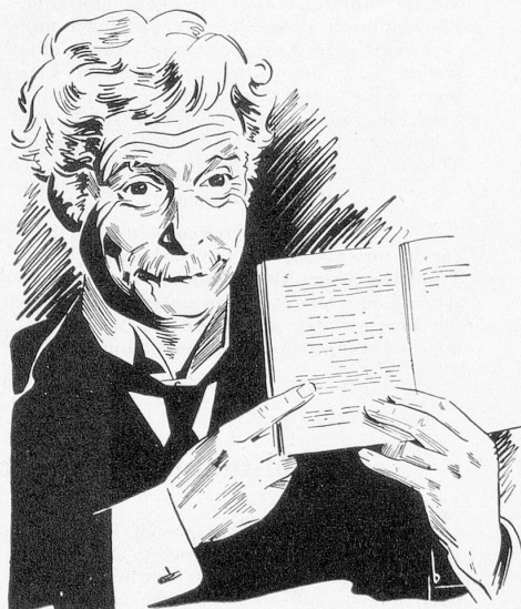
Robert Donat in «Leb wohl, Mr. Chips»

Alle diese so wundervoll beobachteten und von Sam Wood und den beiden unvergleichlichen Hauptdarstellern Robert Donat