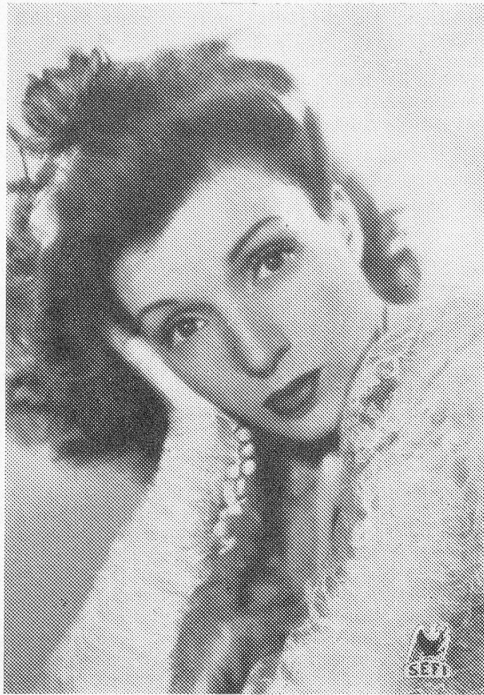
Conchita Montenegro, die rassige Spanierin, spielt in verschiedenen Filmen der italienischen Produktion. Ihr neuester Film be- titelt sich «Die Geburt der Salomé» , der demnächst in Zürich zur schweiz. Uraufführung gelangt.

Film, dessen Vertreter in der Schweiz die SEFI ist, beendete diesen großen historischen Film. In kurzer Zeit findet die schweizerische Uraufführung im Cinéma Urban in Zürich statt.