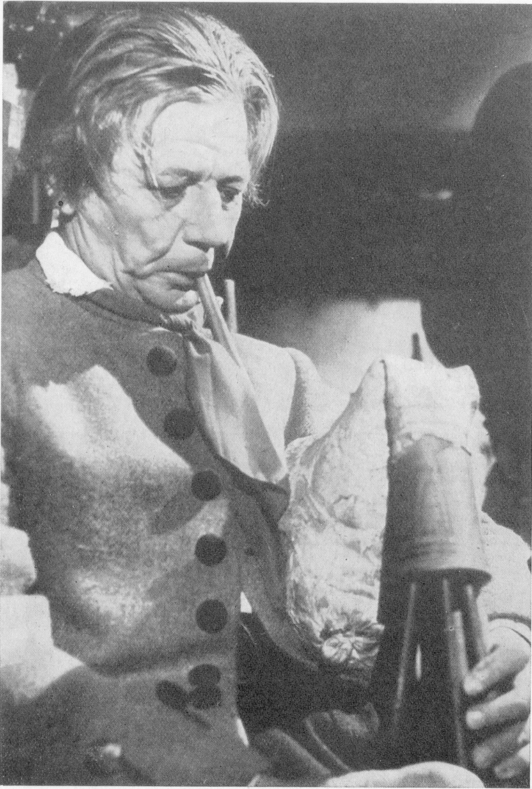
Paul Hörbigers schönste Rolle ist die des lieben Augustin, des berühmtesten aller Wiener Volks- und Bänkelsänger, in dem neuen Wien-Film der Terra: «Der liebe Augustin». In weiteren Hauptrollen spielen Hilde Weißner, Maria Andergast, Michael Bohnen, Richard Romanowsky u. a.

rika und hoffen, durch größere Verbreitung ihrer Filme in diesen Gebieten den Ausfall einiger europäischer Länder wettzumachen. Das beste Mittel dazu ist natürlich die Verpflichtung von Künstlern, die in Süd- und Mittelamerika bekannt und beliebt sind. Und so «importiert denn Hollywood heute in steigender Zahl die Stars des Südens.