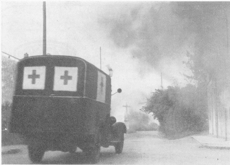
Eine Szene aus dem Film «Die Oase im Sturm». Une scène du film «L'Oasis dans la Tourmente».

Schade, daß so vieles an diesem Film abstößt, denn er hat großartige Momente, in den stimmungsgeladenen Bildern von Burel — die Photographie ist meisterlich! Die Musik von Raoul Moretti ist gut, solange sie «fond» bleibt, gleichsam als Stimme des Meeres und der Dinge mit dem Geschehen verschmilzt, doch sie ist unerträglich, wenn sie sich vordrängt, wenn man ihrer «bewußt» wird.