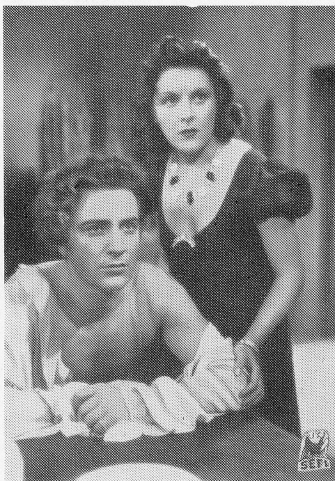
Imperio Argentina und Rossano Brazzi in dem Großfilm «TOSCA». Prod. Scalera-Film Rom.

Allen Schwierigkeiten zum Trotz, scheinen die englischen Filmkreise gewillt, die Farbenfilm-Produktion, die vor dem Kriege