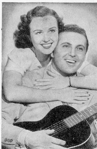
There's Magic in Music. Margaret Lindsay und Allan Jones spielen zwei Hauptrollen in «Frühlings-Serenade». Produktion Paramount.

Hunderte von deutschen Kameraleuten stehen an der Front, sitzen — neben sich das MG — mit ihrer Askania in der Heckkanzel der Bombenflugzeuge, sie kreuzen auf ihren Tanks quer durch die Wüste, Tod und Verderben, Kampf, Kampf und immer wieder Kampf filmend. Oder sie