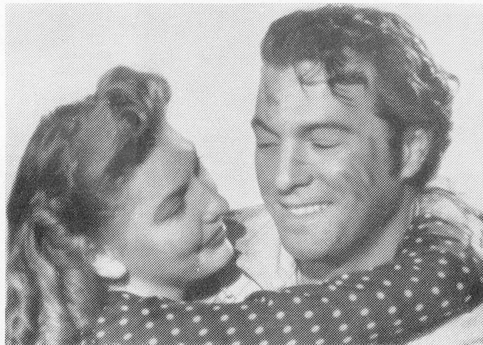
Une scène du grand film d'aventures et d'amour «Abbandono».

Le succès des films britanniques aux Etats-Unis se reflète le mieux dans l'accroissement des prix de vente. Un nouveau