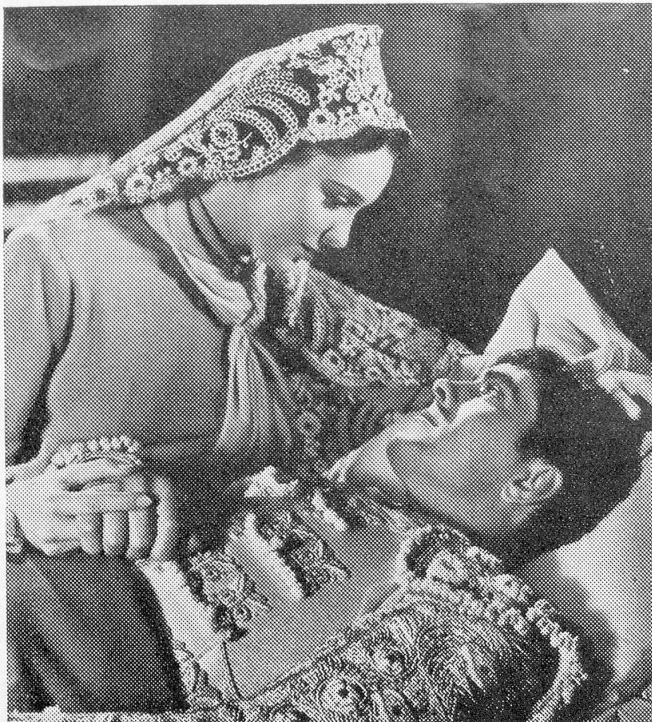
Szene aus dem herrlichen Farbenfilm «Blutiger Sand» der 20th Century-Fox Corp.