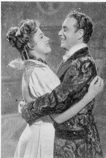
Wieder im sicheren Hafen gelandet

In den letzten Wochen wurden 2 bis 3 Schweizerfilme angeboten, doch diese wurden nicht verkauft; erstens weil sich die Verkaufsgebühren hier und dort geändert haben, zweitens die Themen hier nicht gefallen! Bei normalen Verhältnissen hätte