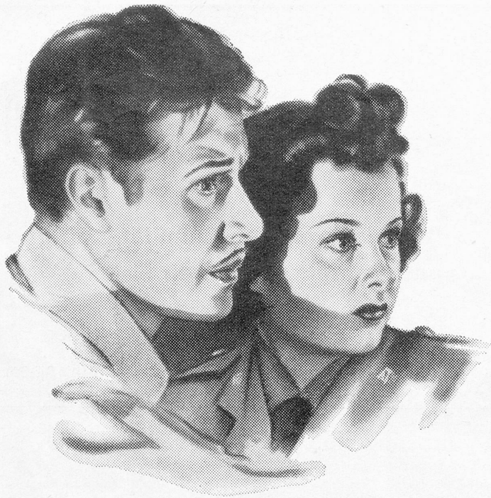
Don Ameche und Joan Benett in «Correspondant de guerre» (20th Century-Fox)

schaft wahrt auf Verlangen auch die Urheberpersönlichkeitsrechte auf den eingangs genannten Gebieten. Die Genossenschaft kann sich an ähnlichen Organisationen beteiligen oder auf Beschluß des Vorstandes die Verwaltung ihrer Rechte einer solchen Organisation übertragen. Die Genossenschaft bezweckt keinen eigenen Gewinn. Für die Verbindlichkeiten der Genossenschaft haftet nur das Genossenschaftsvermögen. Die persönliche Haftbarkeit der Genossenschafter ist ausgeschlossen. Die Mitteilungen erfolgen schriftlich; die Bekanntmachungen durch das Schweizerische Handelsamtsblatt. Der Vorstand besteht aus mindestens 3 Personen, und zwar aus dem Präsidenten, den