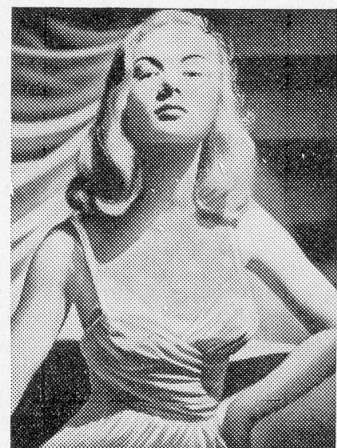
Veronika Lake in „Die Narbenhand“