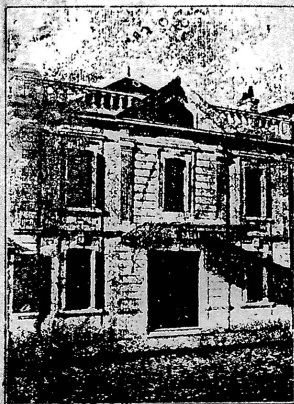
DIRECTEUR : E. LASNIER

SALLE de FÊTES avec SCÈNE et DÉCORS Pour Concerts, Représentations Théâtrales, Soirées de Sociétés, de Familles, etc. (CINQ CENTS PLACES)