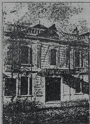
DIRECTEUR : E. LASNIER