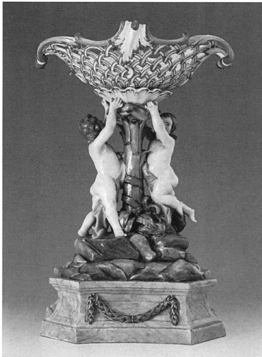
Tafelaufsatz aus Zürcher Porzellan. ... 1775/80, H 40 cm. Versteigert bei Schuler, Zürich am 19.3.02 für Fr. 65'000.-