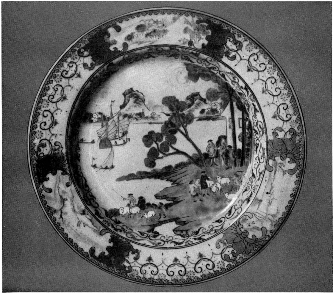
Abb. 6. Teller, Famille rose, Europäer mit Schafherden, auf dem Rand 3 goldgefasste Reserven mit rosagemalten Landschaften Durchmesser: 22 cm