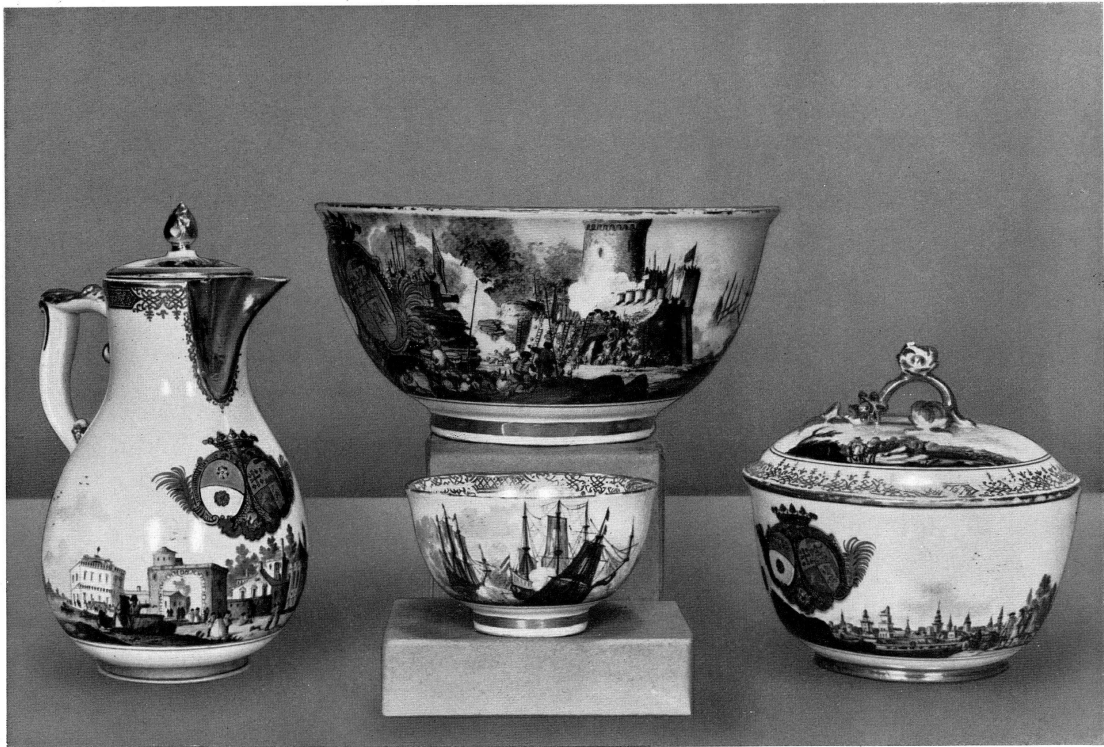
Abb. 1. Kaffeekännchen, Schwemmschale, Zuckerdose und Tasse mit bunten Landschaftsdarstellungen und Kriegsszenen, bemalt von Bonaventura, Gottlieb Häuer, um 1740 Wappen der Familie Mocenigo-Cornaro in Venedig