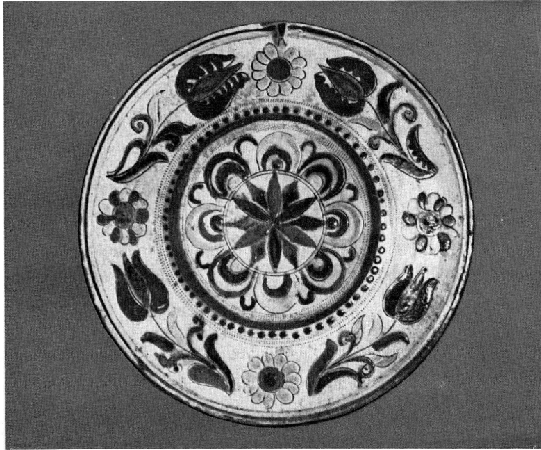
Abb. 3. Rückseite zu Abb. 2