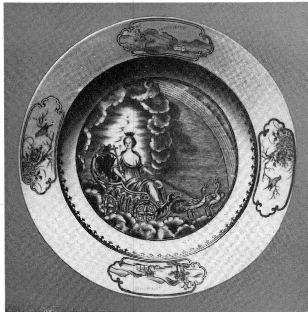
Abb. 7. Teller, Juno im Pfauenwagen. Grau. Am Rand 4 Reservoen, goldumrahmt. Durchmesser: 23 cm