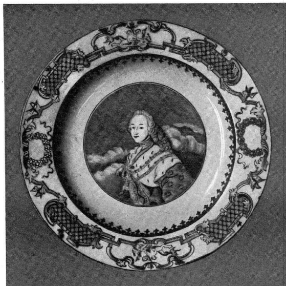
Abb. 8. Teller mit dem Bildnis Christian VI von Dänemark, grau mit Gold, auf dem Rand Laub und Bandelwerkborder. Durchmesser: 23 cm