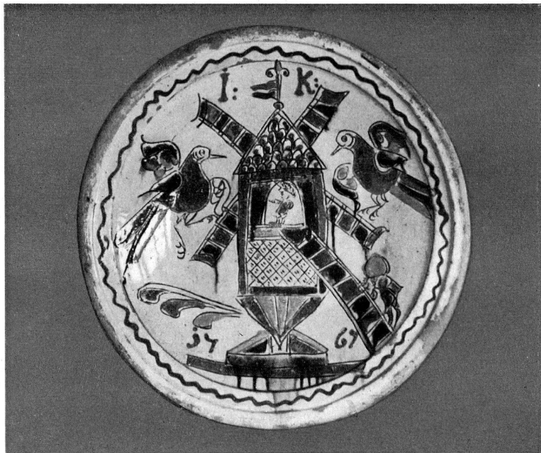
Abb. 4. Heimberger Platte, datiert 1767