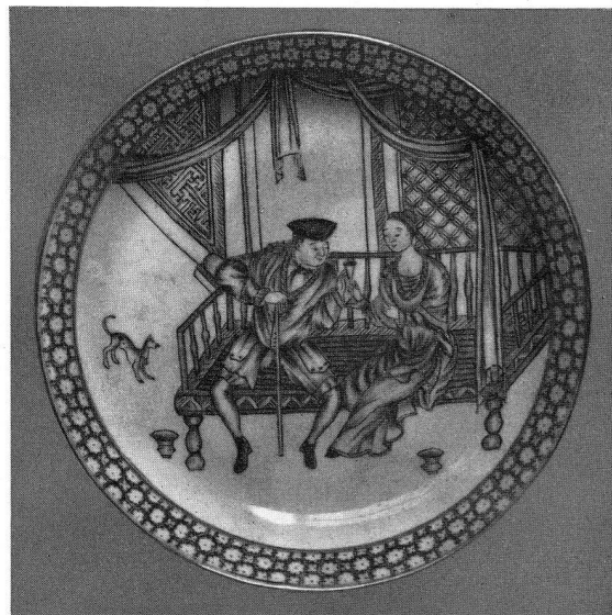
Abb. 9. Untertasse. Herr auf Ruhebett und Dame mit Kelchglas. Grau. Gesichter, Haare und Hände fleischfarben. Durchmesser: 11,4 cm