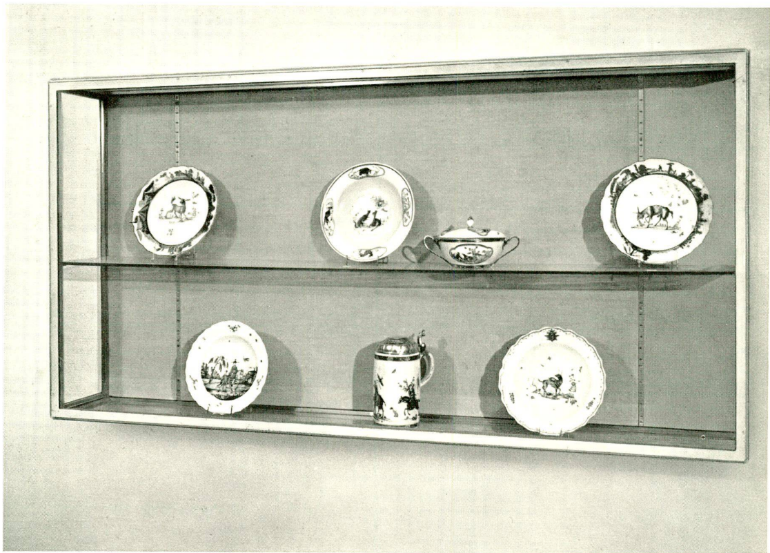
Eine Loewenfinck-Vitrine aus der Ausstellung im Kunsthaus Zürich, «Schönheit des 18. Jahrhunderts», Oktober 1955

Wir haben von der Ausstellung «Schönheit des 18. Jahrhunderts» 12 verschiedene Aufnahmen von Porzellanvitrinen herstellen lassen, zur Dokumentation des ausgestellten Kunstgutes und zur Erinnerung an unsere Jubiläumsausstellung. Größe der einzelnen Photos, wie die Abbildungen zeigen. Bestellung bitte an Sekretariat, Museggstraße 30, Luzern. Preis der ganzen Zwölferserie Fr. 25.-. Einzelne Karten können aus administrativen Gründen nicht abgegeben werden.