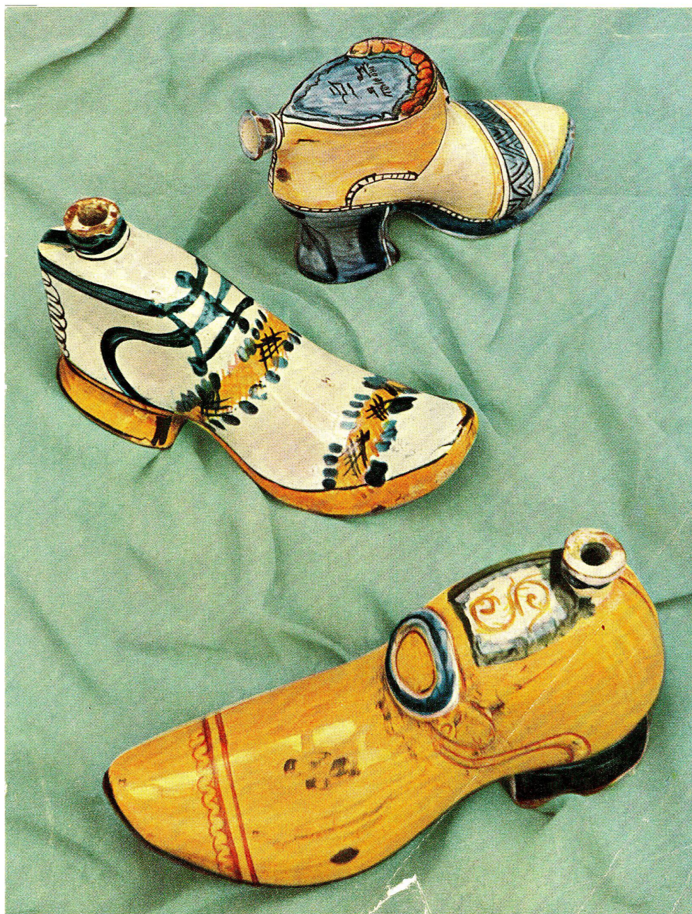
Sabots de Noël, Italien 17. und 18. Jahrhundert. Ballymuseum, Felsgarten, Schönenwerd

Bulletin de la société suisse des amis de la céramique